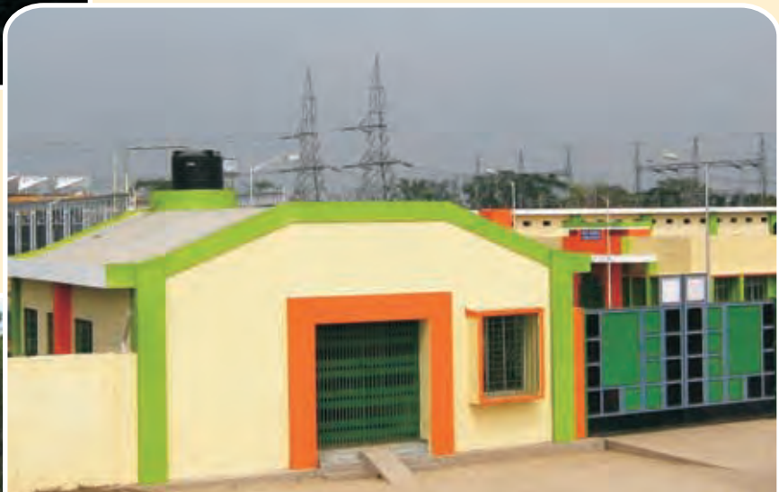
दंकुनी स्थित ईएमडी कारखाने का गेट EMD Loco Factory Gate, Dankuni