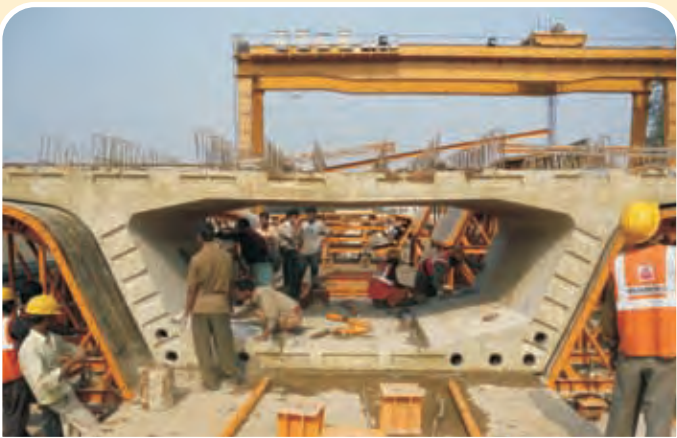
जोका-मोमिनपुर मेट्रो परियोजना के एक भाग पर जारी फिनिशिंग कार्य Segment finishing work in progress In Joka-Mominpur Metro Project