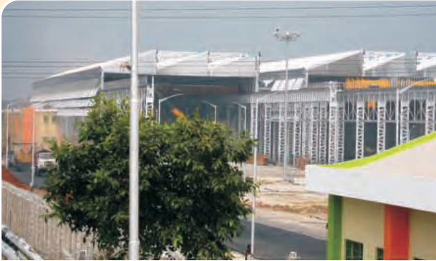
पूर्ण ईएमडी कारखाना / दंकुनी Completed EMD Loco Factory, Dankuni