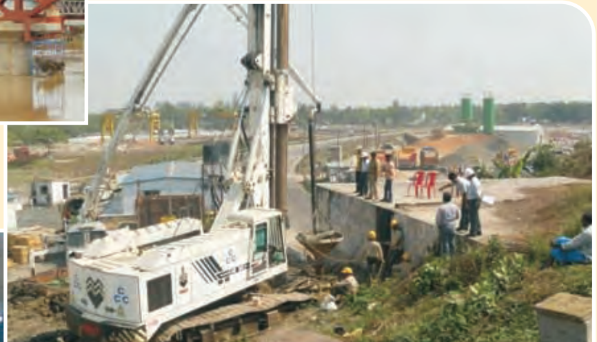
बूम प्लेसर द्वारा कंक्रीटिंग Concreting with Boom Placer