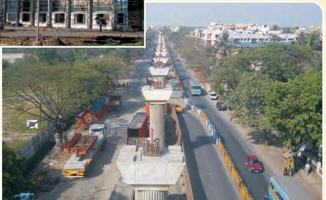
जोका-मोमिनपुर मेट्रो लाइन View of Joka-Mominpur Metro Line, Kolkata