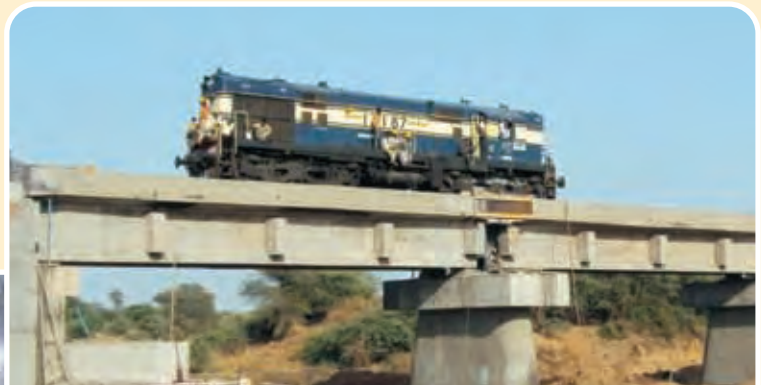
भरुच-देहज आमान परिवर्तन परियोजना पर लोको परीक्षण Loco Trial on Bharuch-Dahej GC Project