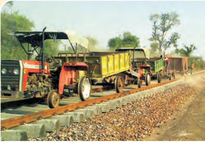
मोडिफाइड ट्रैक्टर द्वारा गिट्टियों की अनलोडिंग Ballast unloading with modified Tractor