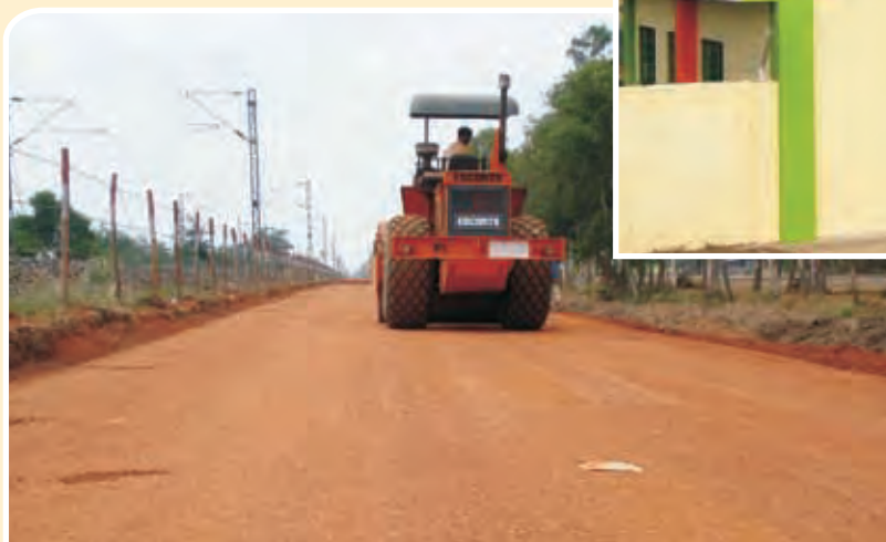
पंशकुड़ा-खड़गपुर तीसरी लाइन परियोजना के अधीन जारी फार्मेशन कार्य Formation work under progress In Panshkura-Kharagpur 3 rd Line Project