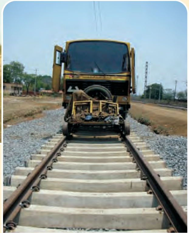
बैकुंठ यार्ड में एफबीडब्ल्यू मशीन द्वारा कार्य FBW Machine in working at Baikunth yard