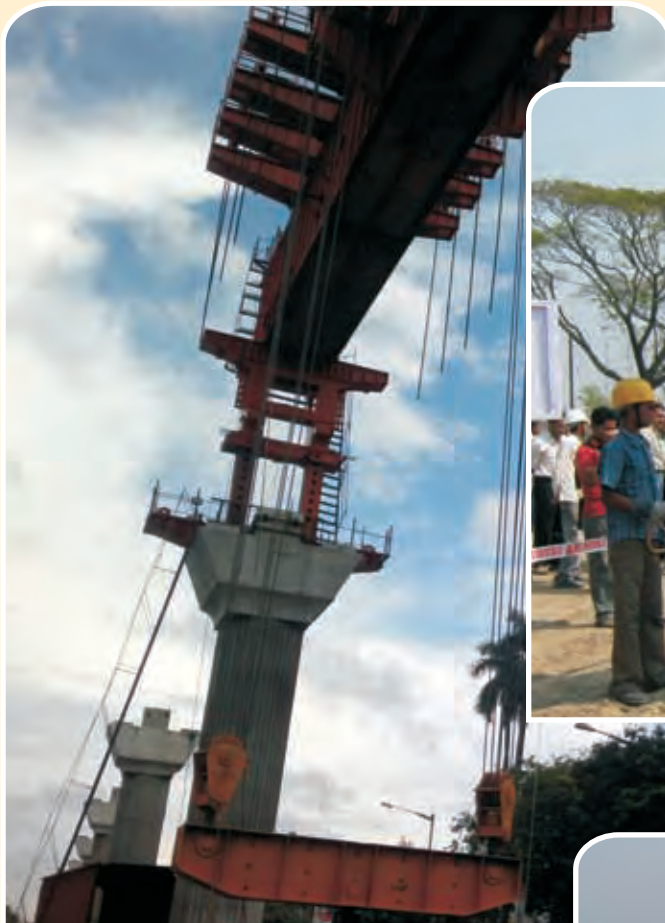
जोका-मोमिनपुर मेट्रो लाइन पर गर्डर लॉन्चिंग कार्य Girder Launching in Joka-Mominpur Metro Line