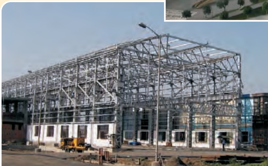
निर्माणाधीन ईएमडी लोको कारखाना/दंकुनी EMD Loco Factory Dankuni Under Construction