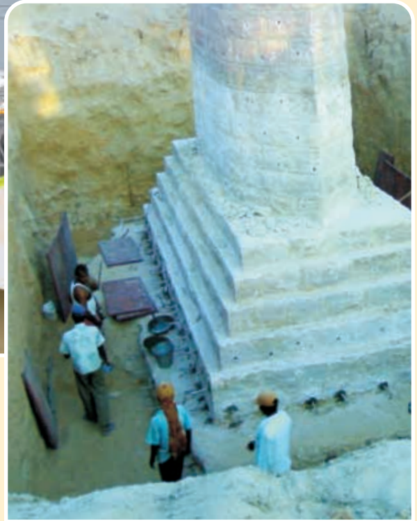
उत्खनन के बाद खम्भे का निर्माण – नीव परीक्षण Pier after Excavation - Examination of Foundation