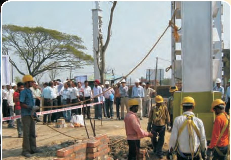
दंकुनी कारखाने में जारी निर्माण कार्य Work in progress at Dankuni Factory