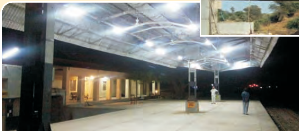
भिलडी-समदड़ी आमान परिवर्तन परियोजना – पूर्ण प्लेटफार्म Bhilldi-Samdari GC Project-Completed Platform