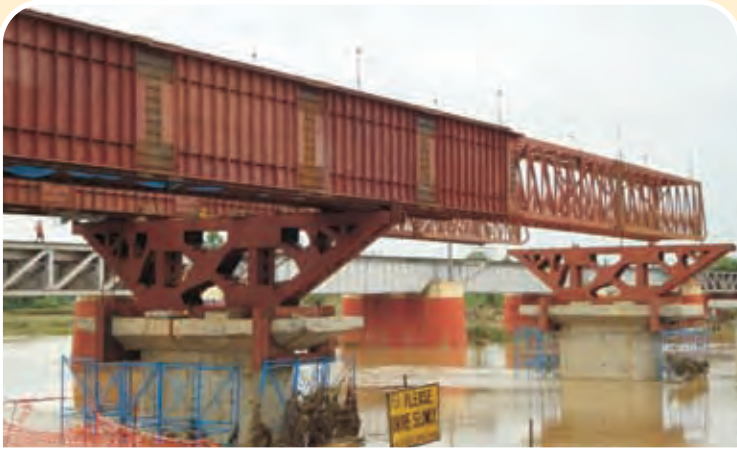
पंशकुड़ा-खड़गपुर तीसरी लाइन परियोजना पर स्टील गर्डर लॉन्चिंग कार्य Steel Girder Launching in Panskura-Kharagpur 3 rd Line Project