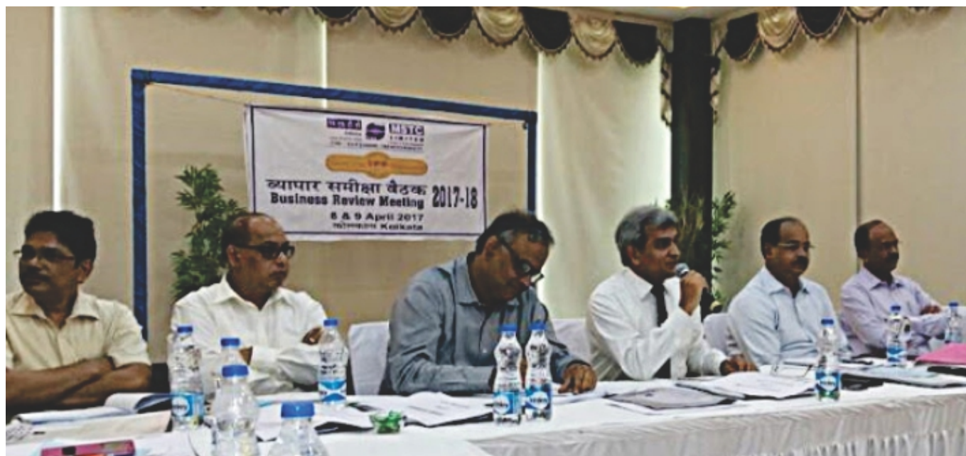
कोलकाता में दिनांक 08 एवं 09 अप्रैल, 2017 को वार्षिक व्यवसाय समीक्षा सम्मेलन का आयोजन। Annual Business Review Meeting held on 8th and 9th April, 2017 at Kolkata.