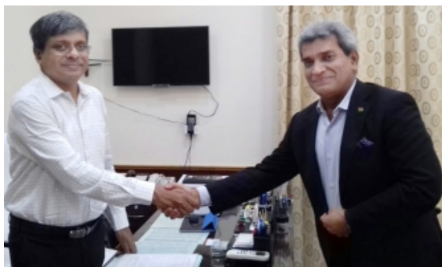
दिनांक 18.05.2018 को मुख्य सचिव, ओडिशा सरकार से अध्यक्ष एवं प्रबंध निदेशक की मुलाकात। CMD meeting Chief Secretary, Govt. of Odisha on 18.05.2018.

उप – उपस्थित, अनु – अनुपस्थित एवं X – कार्यालय में नहीं