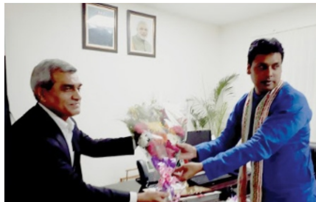
दिनांक 27 मार्च, 2018 को त्रिपुरा के माननीय मुख्य मंत्री, श्री बिप्लब कुमार देब से सीएमडी की मुलाकात। CMD meeting Hon'ble Chief Minister of Tripura Shri Biplab Kumar Deb, on 27th March, 2018.

कंपनी (प्रबंधन एवं प्रशासन) नियम 2014 के नियम 12(1) तथा अधिनियम की धारा 92(3) के अनुपालन में वित्तीय वर्ष 2017-18 के लिए एमजीटी-9 प्रारूप में वार्षिक रिपोर्ट का निष्कर्ष इस रिपोर्ट के साथ निर्धारित प्रारूप में अनुलग्नक III के रूप में संलग्न किया गया है।