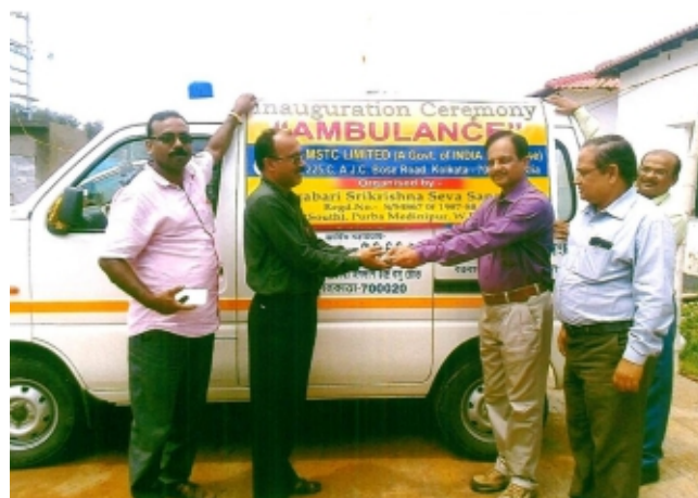
एमएसटीसी ने सीएसआर पहल 2017-18 के अंतर्गत पूर्व मिदनापुर, पश्चिम बंगाल के सुदूर गाँवों में निर्धन रोगियों को निःशुल्क चिकित्सा सेवा प्रदान करने हेतु मोबाइल मेडिकल वैन के लिए वित्त पोषण का प्रबंध किया।

Company Secretary MSTC Limited 225-C, AJC Bose Road Kolkata-700020 Tel. No. : (033) 2287-9627 Fax : (033) 2287-8547