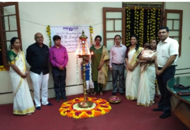
तिरुवनंतपुरम में 30 अगस्त, 2017 को एमएसटीसी के नए कार्यालय परिसर का उद्घाटन । Inauguration of new Office premises of MSTC in Thiruvananthapuram on 30th August, 2017.

निदेशकों ने 31 मार्च, 2018 को समाप्त वर्ष के लिए जारी कारोबार के आधार पर वार्षिक लेखा तैयार किया है ।