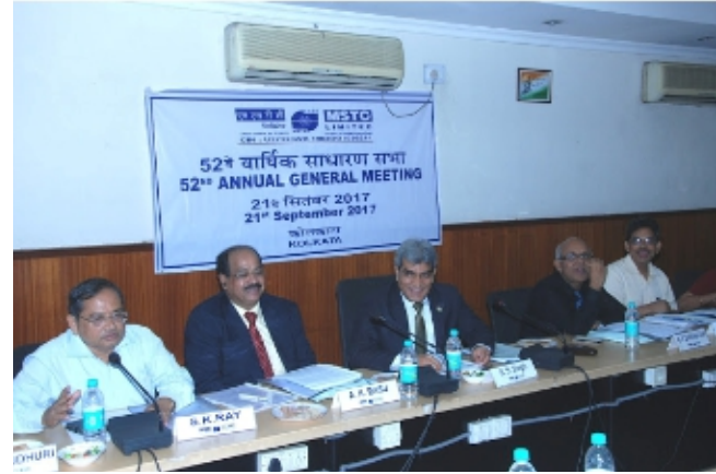
कोलकाता में दिनांक 21.09.2017 को एमएसटीसी लिमिटेड की 52वीं वार्षिक साधारण सभा का आयोजन। 52nd Annual General Meeting of MSTC Limited held at Kolkata on 21.09.2017.