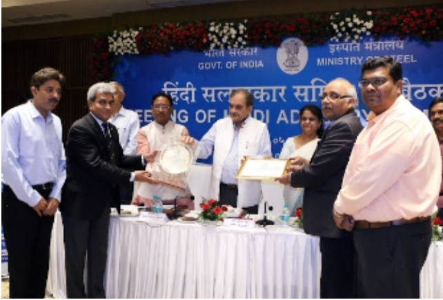
वर्ष 2017-18 के लिए एमएसटीसी लिमिटेड को "इस्यात राजभाषा विशिष्ट सम्मान" प्रदान किया गया MSTC Limited conferred with the "Ispat Rajbhasa Special Award" for the year 2017-18