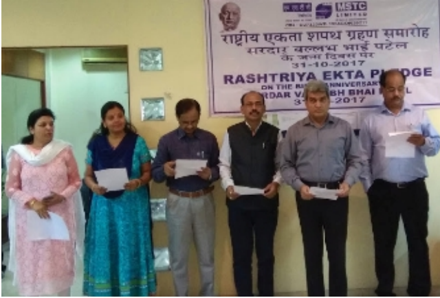
कोलकाता प्रधान कार्यालय में 31 अक्टूबर, 2017 को एमएसटीसी के निदेशकों, कार्यपालकों एवं कर्मचारियों के साथ राष्ट्रीय एकता दिवस मनाया गया। Rashtriya Ekta Diwas - National Unity Day celebrated on 31st October, 2017 with the Directors, executives and employees of MSTC at Kolkata Head Office.