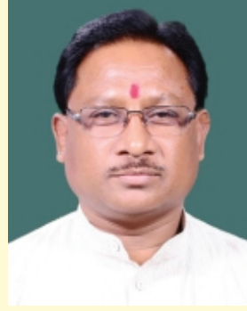
माननीय इस्पात राज्यमंत्री श्री विष्णु देव साई Hon'ble Minister of State for Steel Shri Vishnu Deo Sai