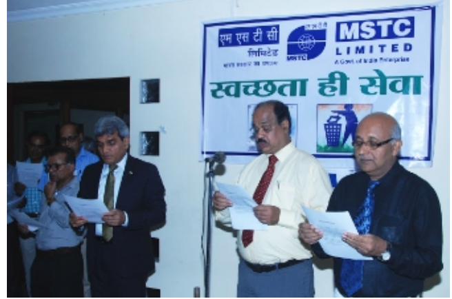
एमएसटीसी में स्वच्छ भारत अभियान के दौरान 15 सितंबर से 05 अक्टूबर 2017 तक स्वच्छता कार्यक्रम A Swachhata programme held at MSTC during the Swachh Bharat Drive from 15th September to 5th October 2017

स्टेकधारकों द्वारा कंपनी के प्रबंधन पर जताए गए भरोसे को बरकरार रखने के उद्देश्य से एमएसटीसी अपने प्रबंधन के हर स्तर पर पारदर्शिता और सत्यनिष्ठा के लिए संपूर्ण प्रयत्नशील रहता है।