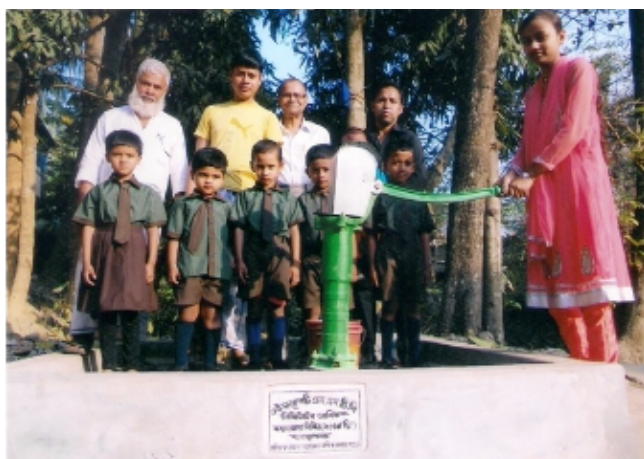
सीएसआर पहल 2017-18 के अंतर्गत हावड़ा, पश्चिम बंगाल में एक प्राथमिक विद्यालय में एमएसटीसी द्वारा ट्यूबवेल की स्थापना। Installation of Tubewell by MSTC at a primary school in Howrah, West Bengal under CSR initiative 2017-18.

कंपनी सचिव एमएसटीसी लिमिटेड 225-सी, ए.जे.सी. बोस रोड, कोलकाता-700020 दूरभाष - (033) 2287-9627 फैक्स : (033) 2287-8547