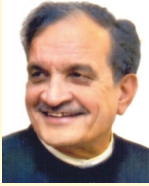
माननीय इस्पात मंत्री चौधरी बीरेंद्र सिंह Hon'ble Minister of Steel Chaudhary Birender Singh