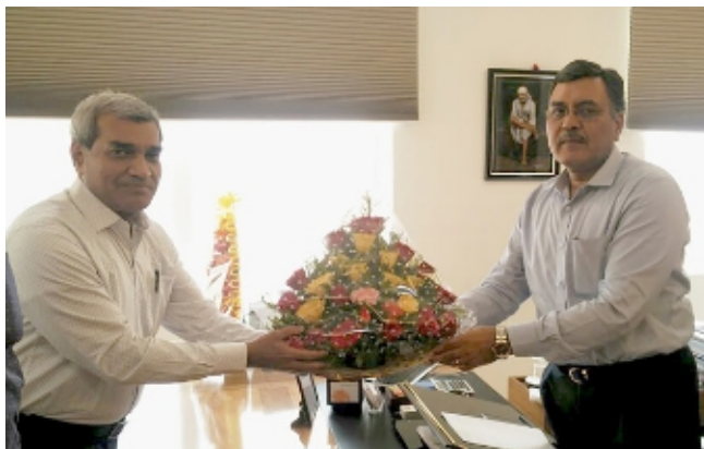
दिनांक 09.03.2018 को मुख्य सचिव, आंध्रप्रदेश सरकार से सीएमडी की मुलाकात। CMD meeting Chief Secretary, Govt. of Andhra Pradesh on 09.03.2018.