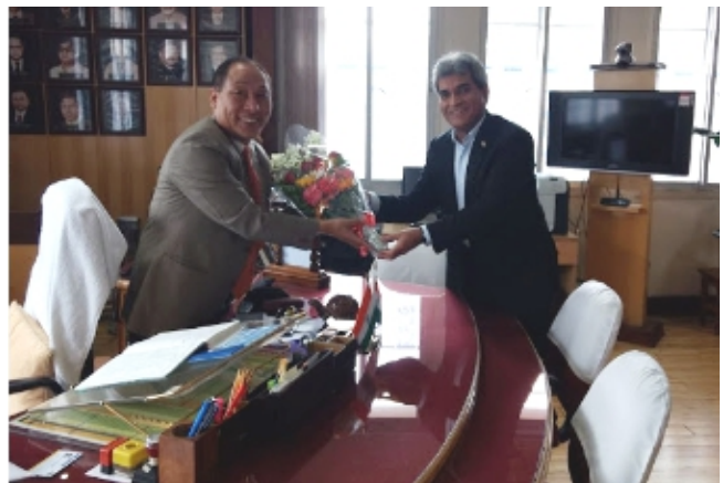
सीएमडी ने 9 अगस्त, 2017 को मुख्य सचिव, मेघालय सरकार से मुलाकात की । CMD called on Chief Secretary, Govt. of Meghalaya on 9th August, 2017.

The Directors have prepared the Annual Accounts for the year ended 31 st March, 2018 on a going concern basis.