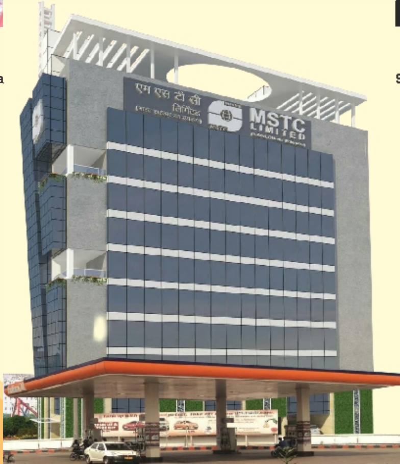
न्यू टाउन, कोलकाता में एमएसटीसी का निर्माणाधीन निगमित कार्यालय MSTC's proposed Corporate Office Building being constructed at New Town, Kolkata