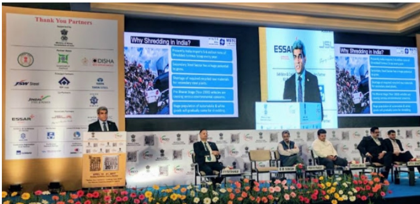
इंडिया स्टील 2017 में ऑटो श्रेडिंग प्लांट पर सीएमडी, एमएसटीसी की प्रस्तुति। Presentation by CMD, MSTC on Auto Shredding Plant at INDIA STEEL 2017.