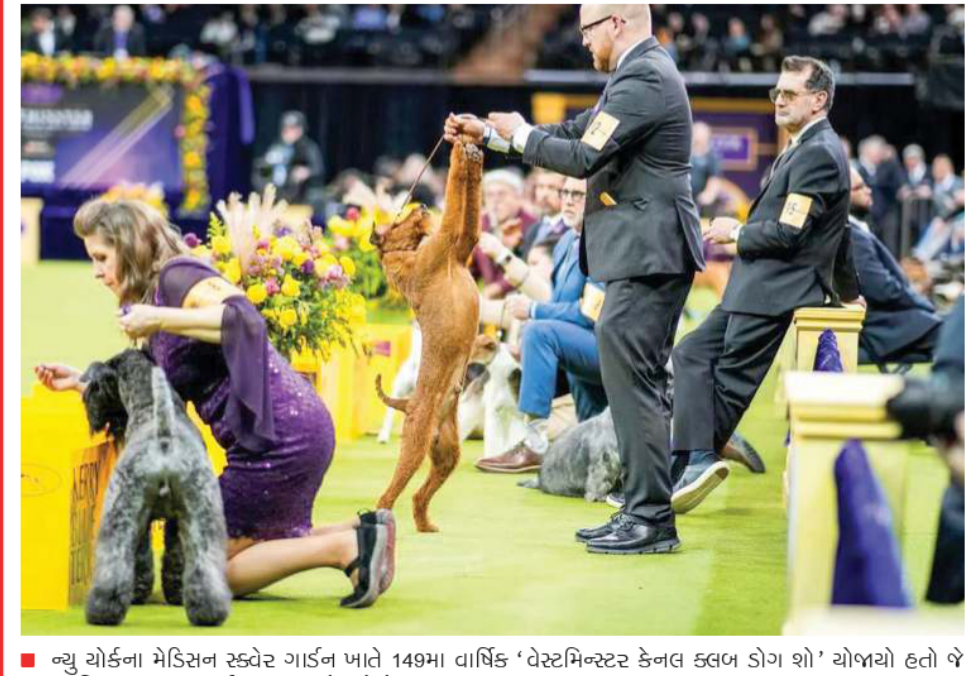
દરમિયાન શ્વાન સ્પર્ધા કરતા નજરે પડે છે.

આરએસએસએ રાજધાનીમાં નવી દિલ્હી, તા. 12: 4 એકરનો તેના ભવ્ય નવા કાર્યાલયનું અનાવરણ કર્યું છે, એક વિશાળ સંકુલ, જેને સંગઠન અને તેના સહયોગીઓ માટે એક સંકલિત જ્ઞાનતંતુ કેન્દ્ર રૂપે ડિઝાઇન કરવામાં આવ્યું છે. 12 માળ ઊંચા ત્રણ ભવ્ય ટાવર, પદાધિકારીઓ અને રહેણાક કર્મચારીઓ માટે 300 રૂમ, વૈચારિક મેળાવડા માટે બે વિશાળ ઓડિટોરિયમ, ઇતિહાસથી ભરપૂર પુસ્તકાલય અને શાખાઓ (સવારની સંભાઓ) માટે બનાવાયેલ વિશાળ, સુશોભિત લૉન સાથે આ સંકુલ સંઘના વધતા કદને પણ પ્રતિબિંબિત કરે છે. કારણ કે, તે દિલ્હીમાં ઉદાસીન આશ્રમ સ્થિત તેના જૂના છે, એક શક્તિ કેન્દ્ર છે, જ્યાં અને ખંડેર થઈ ગયેલા કાર્યાલયથી