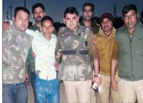
मुठभेड़ में घायल बदमाश को ले जाती पुलिस।