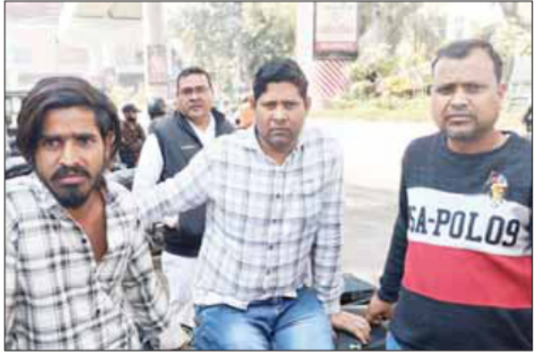
पोस्टमार्टम हाउस पहुंचे परिजन।

हादसे में दोस्त गंभीर रूप से घायल, परिजन हुए बदहवास