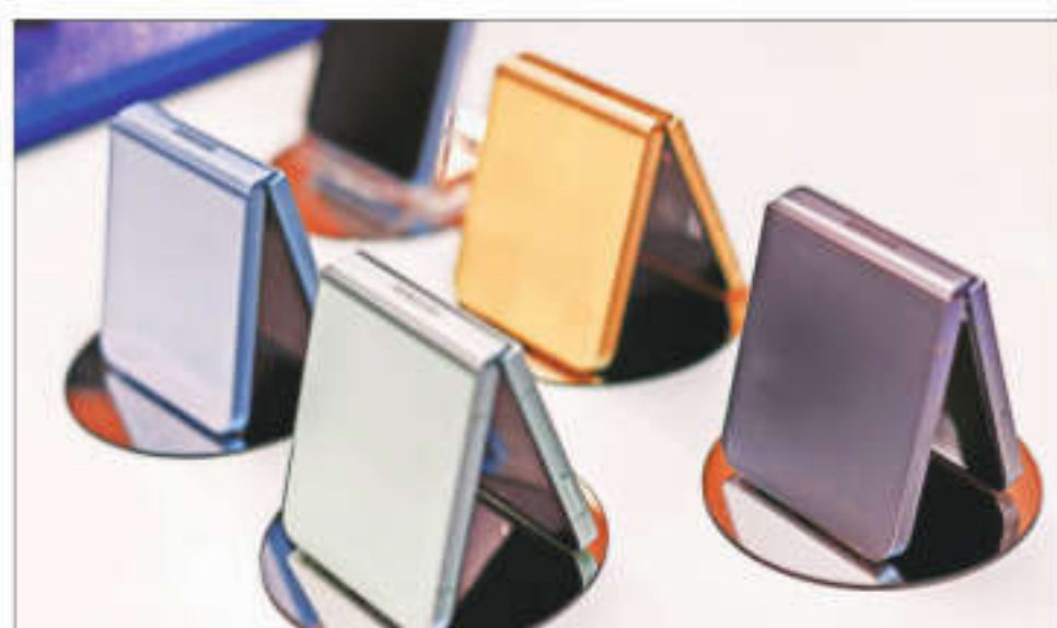
The clamshell Galaxy Z Flip 6 has a longer battery life and higher resolution camera

The world's largest smartphone maker pioneered the foldable segment in 2019, but Wednesday's launch is crucial as Samsung's foldable phone shipment share fell from 81% in 2022 to 63% in 2023 with competitors surging into the