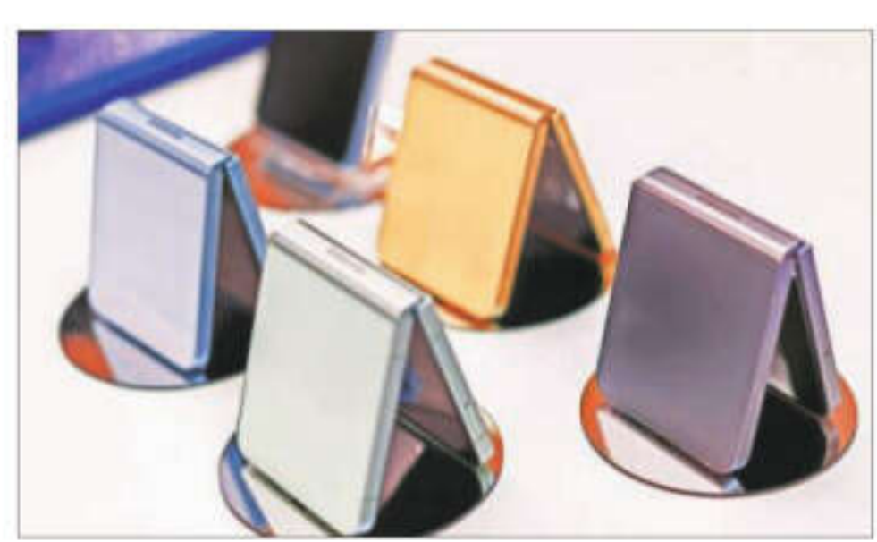
The clamshell Galaxy Z Flip 6 has a longer battery life and higher resolution camera.

SAMSUNG ELECTRONICS UNVEILED its latest foldable smartphones on Wednesday, making its priciest flagship model lighter and slimmer and bolstering AI functions as it challenges Apple's dominance in the premium market. Samsung is also offering more sophisticated health monitoring functions to drive new demand for accessories such as its smartwatch, as well as a new ring for easy health monitoring and screen control. The world's largest smartphone maker pioneered the foldable segment in 2019, but Wednesday's launch is crucial as Samsung's foldable phone shipment share fell from 81% in 2022 to 63% in 2023 with competitors surging into the