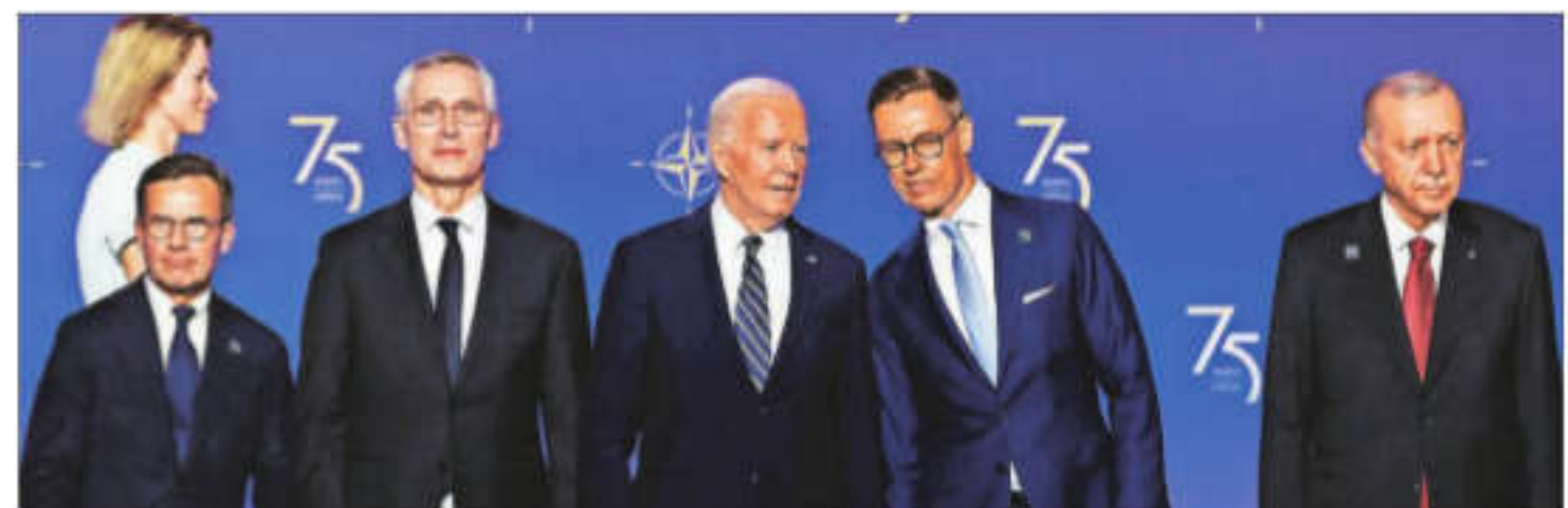
US President Joe Biden, NATO Secretary General Jens Stoltenberg, Finland's President Alexander Stubb, Swedish Prime Minister Ulf Kristersson, Turkish President Tayyip Erdogan and Estonian Prime Minister Kaja Kallas attend a NATO summit to mark 75th anniversary of the alliance, in Washington on Wednesday.