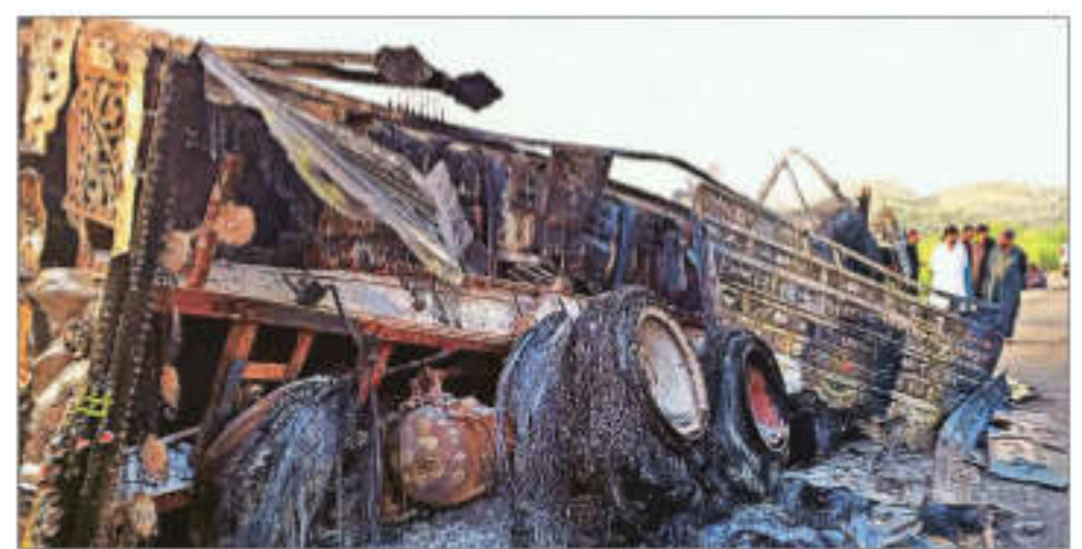
People look at a burnt vehicle after militants conducted deadly attacks in Balochistan on Monday

BEIJING URGED THE US to "stop its wrong practices" after Chinese companies were included on a sanctions list that's designed to target supply chains feeding Russia and hobble its wartime economy, the ministry of commerce said.