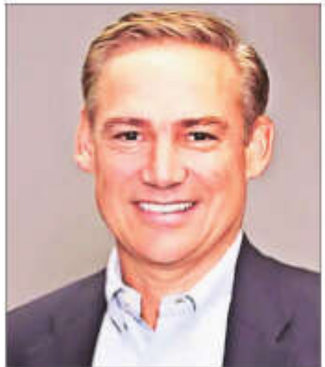
NASA's decision to use SpaceX to bring astronauts back is a setback to new Boeing CEO Kelly Ortberg

That leaves Ortberg, who took over the top job earlier this month, and the senior leader-