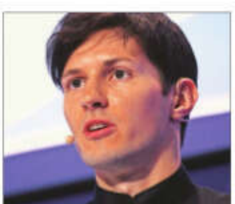
Pavel Durov is being held in custody as part of a cyber criminality investigation, a prosecutor said on Monday

Though there has been no official French comment on the arrest, French news channel