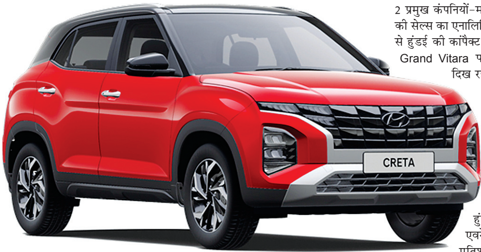
जयपुर@नफा नुकसान रिसर्च

देश में SUV कारों के लिए दीवानगी पिछले कुछ समय से सिर चढ़कर बोल रही है। महंगी होने के बावजूद स्टाइल स्टेटमेंट के