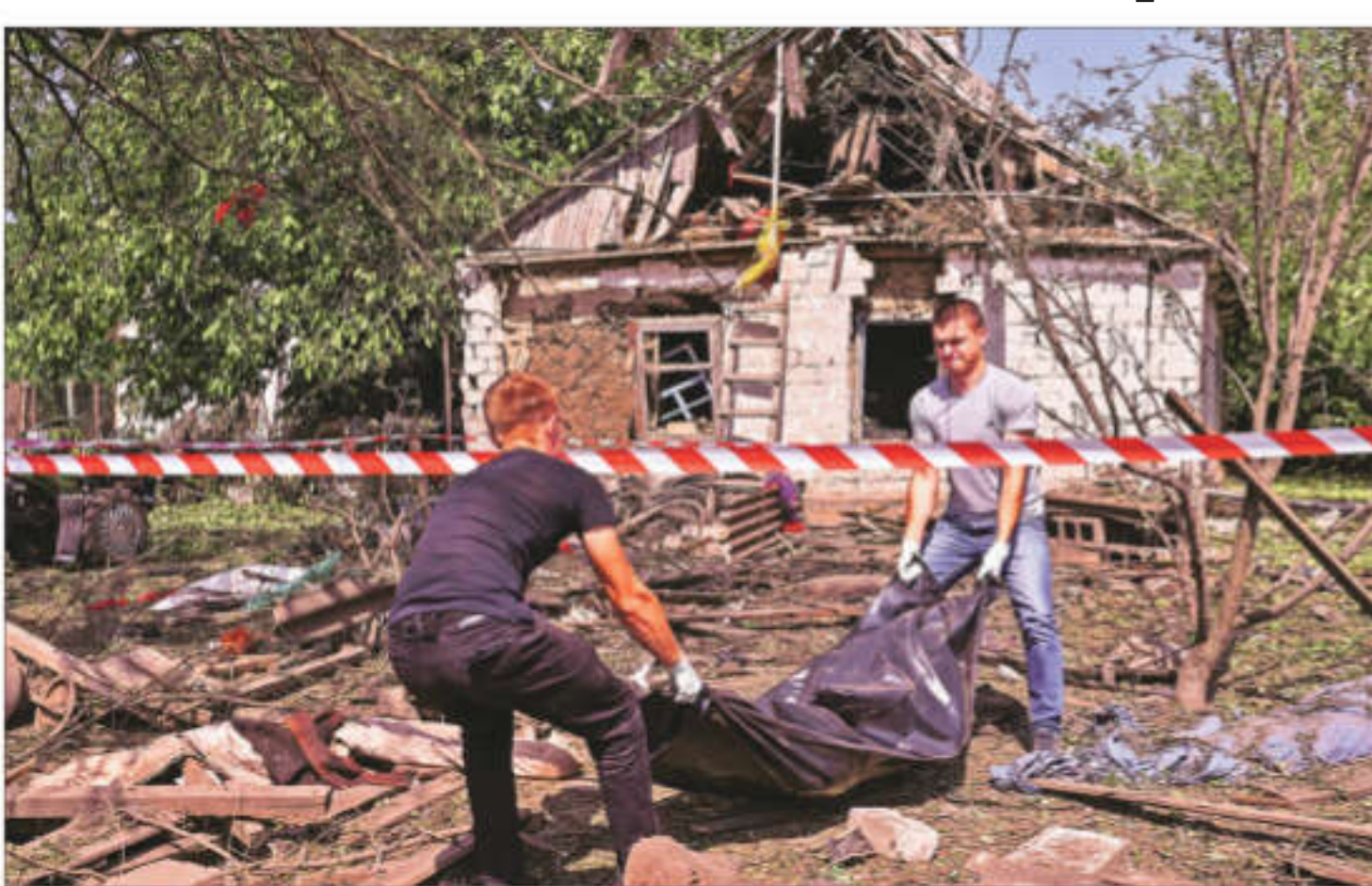
Men carry the body of a local resident killed by a Russian missile strike in the village of Novohupalivka in Zaporizhzhia region on Monday

Monday's missile and drone salvo was Russia's most intense in weeks, coming as Ukraine is claiming new ground in a major cross-border incursion into Russia's southern Kursk region while Russian forces steadily inch forward in