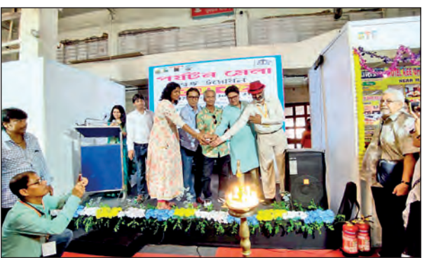
পর্যটন মেলার উদ্বোধনী অনুষ্ঠান।