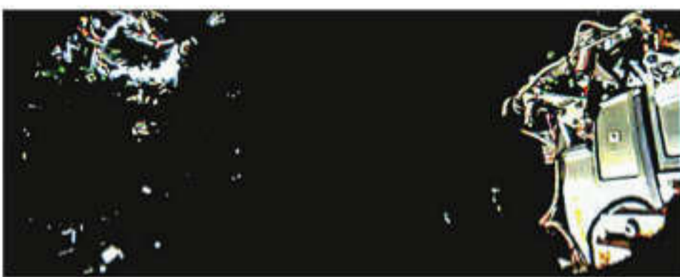
Satellites Chaser and Target during the docking

IN A MAJOR boost to India's ambitious future space missions, ISRO on Thursday successfully performed the docking of satellites as part of the Space Docking Experiment (SpaDeX) and announced that post docking, control of two satellites as a single object was also achieved.