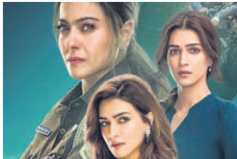
An Ormax report says that Do Patti, the top Hindi OTT movie, got 15.1 million views, or half of Mirzapur's viewership, in 2024.

"OTT original films have seen viewership challenges, and it is not surprising. Series format inherently have higher repeat engagement, social buzz and a longer shelf life, as