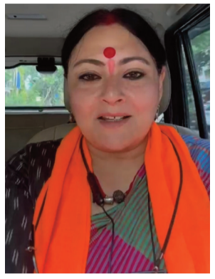
মহাবিদ্যালয়ে। স্ট্রং রুমে নিয়ে আশঙ্কা প্রকাশ করে তিনি একটি বক্তব্য সহ একটি ছোট ভিডিও ক্লিপিং পোস্ট করেছেন

নিজস্ব প্রতিবেদন, মেদিনীপুর: যথেষ্ট ঘাটল ও মেদিনীপুর লোকসভা কেন্দ্রে ভোট গ্রহণ সম্পন্ন হওয়ার পর এবার স্ট্রং রুমে কারচুপির আশঙ্কা প্রকাশ করলেন বিজেপি প্রার্থী অগ্নিমিত্রা পাল।