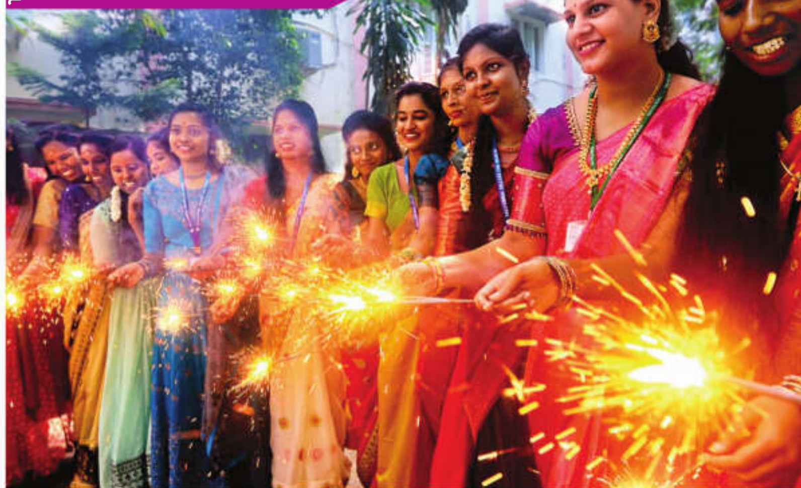
தீபாவளி பண்டிகையை முன்னிட்டு, சென்னை அண்ணாநகர் வளரியம்மாள் மகளிர் கல்லூரி வளாகத்தில் புதன்கிழமை நடைபெற்ற நிகழ்வில் மத்தாப்பு கொளுத்தி மகிழ்ந்த மாணவிகள்.