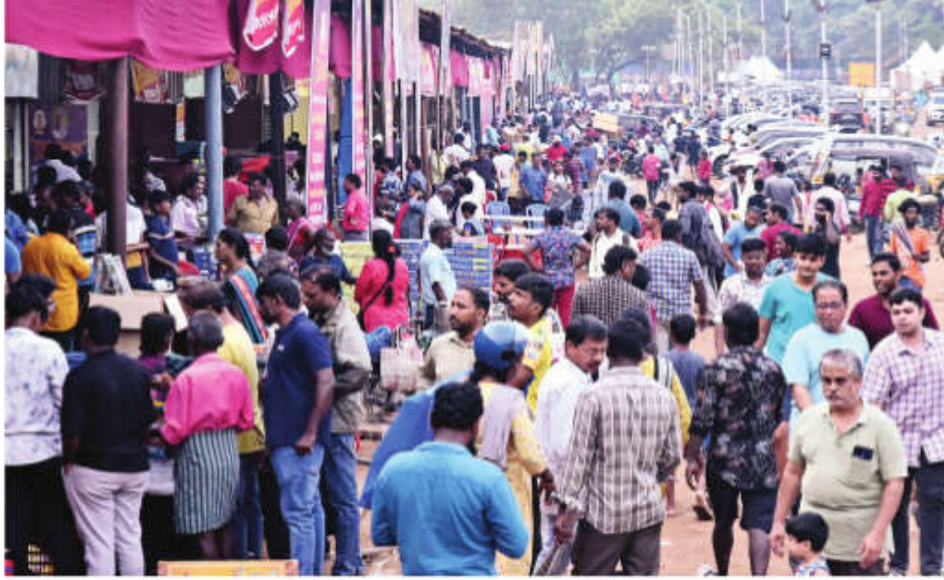
தீபாவளி கொண்டாட்டத்துக்காக பட்டாசுகளை வாங்க சென்னை தீவத்திலில் புதன்கிழமை திரண்ட பொதுமக்கள்.

தீபாவளி பண்டிகையைக் கொண்டாட சென்னை மற்றும் பிற பகுதிகளிலிருந்து சொந்த ஊர்களுக்கு செல்பவர்களின் வசதிக்காக திங்கள், செவ்வாய், புதன் கிழமை மொத்தம் 14,086 பேருக்கு இயக்கப்படும் என போக்குவரத்துத் துறை அறிவித்திருந்தது.