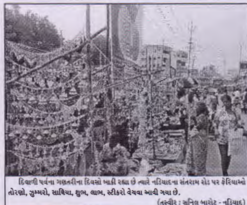
દિવાળી પર્વના ગણતરીના દિવસો ખરી રહ્યા છે ત્યારે નાદિવાળા સંતરામ રોડ પર ફેરિયાઓ તોરણો, સુમ્મરો, સાથિયા, મુળ, લાભ, સંકોરો વેચવા બની ગયા છે.

લિલોગ પંકમમાં ગુનાનો ગ્રાહ કિમ્બોના ડાયમંડની રૂા.૨૫ લાખની રોકડ રકમ ભરેલો બેલ્ટ બંધાવવાનો પ્રયાસ કર્યો કે પછી રાખપુર ગામે રૂા.૨૦ લાખની ચુકાલીની પટના હોય પોલીસ આ ગુનાનો બેલ્ટ બેલ્ટ કરી નથી. આ પોલીસની નિષ્ણતા છે.