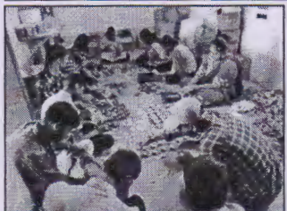
જીન સોષણ સુપ સુરેન્દ્રનગર દ્વારા દિવાળીના અવસરે દિવાળ બાખકો દ્વારા બનાવેલ દિવાડ વરેરેનું પહાર ભાવથી વેચાય કરવામાં આવે છે.

ઝેરી ખોરાક ખાધા બાદ અસર થતા સુરેન્દ્રનગરમાં ૧૩ ગાયનું શંકાસ્પદ મોત થતા જીવહયાપ્રેમીઓમાં રોષ વઢવાર, તા.૧૮ સુરેન્દ્રનગર શહેરમાં દાખલ રોડ કુખાખામર વિસ્તાર અને શહેરના અલગ અલગ વિસ્તારોમાં ઝેરી પદાર્થ ખતા ૧૩ ગાયનું મોત થયું છે. જુજારનારિયા દ્વારા વેચાયેલી બનાબની ફરતો કરવામાં આવતા તંબાકા દોષાખ મળી જાય પાની હતી. પાળીના મોત મા કારણોર થયા તે જાણવા માટે તાપાસ થાય પરવામાં આવી છે બીજી વાર્ષિક પેશોઓમાં ટેબલેટ ગાયોના મોત થવાને લઈ રોગની તપાસી હેવાલ છે.