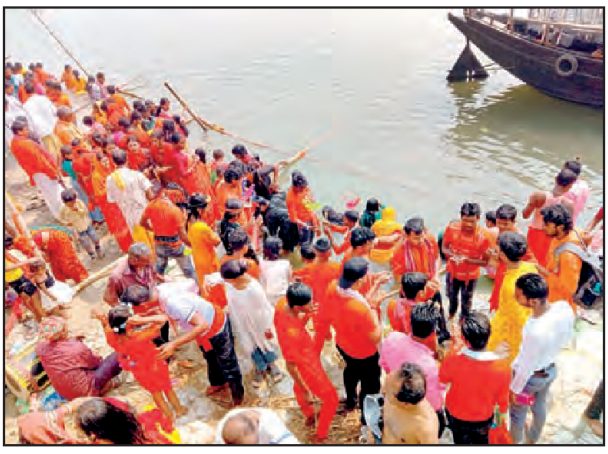
গঙ্গাঘাটে বাঁশের ব্যারিকেডের মধ্যে পুণ্যার্থীদের স্নানের ব্যবস্থা করা হয়েছে।

এদিকে, স্পিড বোটে সারাক্ষণ নজরদারি চালান বিপর্যয় মোকাবিলা দলের ম্মীবা। ঘাট প্রান্তে পল্লিশ ক্যাম্পের পাশাপাশি মেডিক্যাল ক্যাম্পও বসানো হযেছিল।