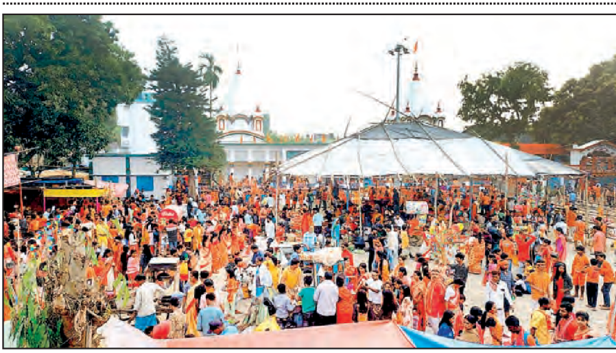
অমৃতি শিব মন্দিরে পুণ্যার্থীদের ভিড়। মালদায়।