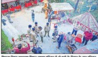
शिमला में एक आश्रम में तैनात पुलिस बलों की एक राउंड गोलियों के पिन्टिंग पत्र और सांफिंग को फिनाल बनाने वाले मॉड को फिनाल फिनाल के दौरान आठ प्रदर्शनकारियों का गिराया गया है।