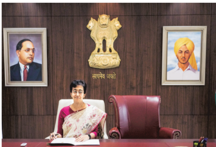
AAP leader Atishi took charge as Delhi's chief minister on Monday, keeping the chair used by her predecessor Arvind Kejriwal empty and "waiting for him", a move the BJP and the Congress said was a "grave insult" to the post. Three ministers also took charge of their respective departments