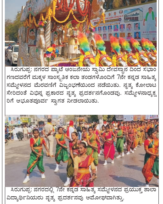
ಸಿರುಗುಪ್ಪ: ನಗರದ ಪ್ಯಾಟಿ ಅಂಜನೆಯ ಸ್ವಾಮಿ ದೇವಸ್ಥಾನ ದಿಂದ ಸಭಾಂಗಣದವರೆಗೆ ಮಕ್ಕಳ ಸಾಂಸ್ಕೃತಿಕ ಕಲಾ ತಂಡಗಳೊಂದಿಗೆ 7ನೇ ಕನ್ನಡ ಸಾಹಿತ್ಯ ಸಮ್ಮೇಳನದ ಮೆರವಣಿಗೆ ವಿಜೃಂಭಣೆಯಿಂದ ನಡೆಯಿತು. ನೃತ್ಯ ಕೋಲಾಟ ಸೇರಿದಂತೆ ವಿಭಿನ್ನ ಪ್ರಕಾರದ ನೃತ್ಯ ಪ್ರದರ್ಶನಗೊಂಡವು. ಸಮ್ಮೇಳನಾಧ್ಯಕ್ಷರಿಗೆ ಅಭಿನಂದನಾರ್ಪಣೆ ಸ್ವಾಗತ ನೀಡಲಾಯಿತು.