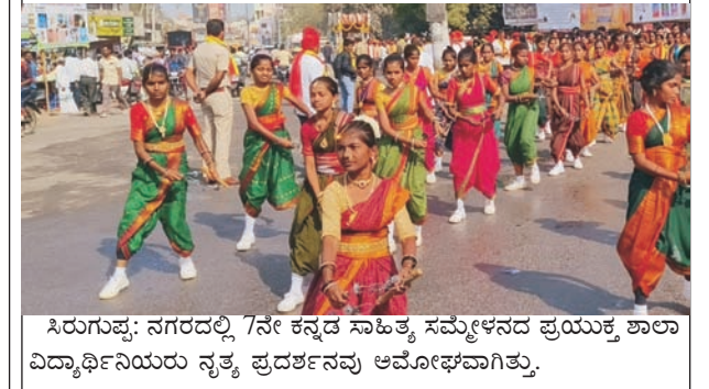
ಸಿರುಗುಪ್ಪ: ನಗರದಲ್ಲಿ 7ನೇ ಕನ್ನಡ ಸಾಹಿತ್ಯ ಸಮ್ಮೇಳನದ ಪ್ರಯುಕ್ತ ಶಾಲಾ ವಿದ್ಯಾರ್ಥಿನಿಯರು ನೃತ್ಯ ಪ್ರದರ್ಶನವನ್ನು ಆಮೋಘವಾಗಿತ್ತು.