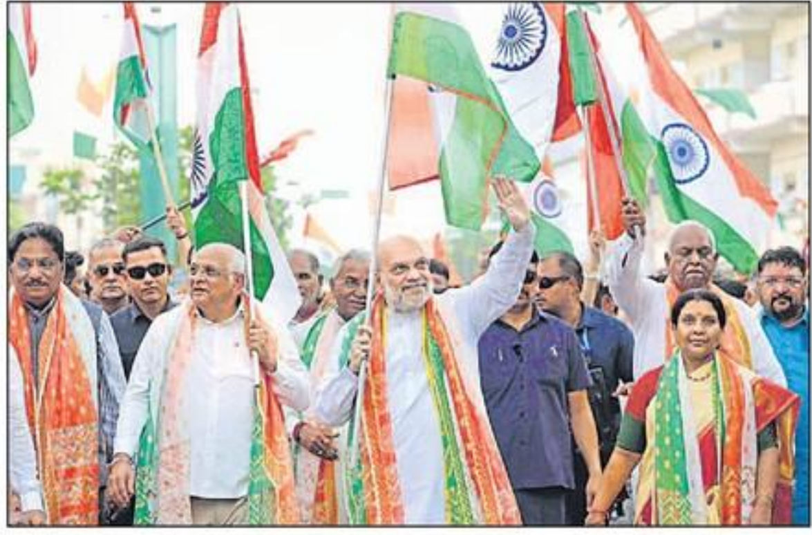
अहमदाबाद में मंगलवार को भाजपा की 'तिरंगा यात्रा' को हरी झंडी दिखाते केंद्रीय गृह मंत्री अमित शाह। साथ में है गुजरात के मुख्यमंत्री भूपेंद्र पटेल।

अहमदाबाद में आयोजित इस कार्यक्रम को हरी झंडी दिखाने के बाद राष्ट्रीय ध्वज थामकर शाह ने कुछ दूरी तक पैदल चलकर यात्रा में हिस्सा