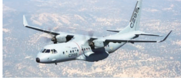
C295 aircraft final assembly line in Vadodra will be the first private sector military aircraft manufacturing facility in India

The manufacturing facility will be inaugurated during Sanchez's official visit to India from October 27 to 29. This will be the first private sector military aircraft manufacturing facility in India and has been described by the government as a "flagship" 'Make in India' initiative in the aerospace sector.