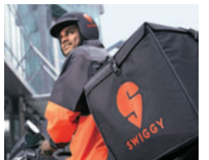
This feature enables users to send gifts and have essentials delivered to parents back home

The firm said this makes it more convenient than ever as one Swiggy's wide range of services, no matter where