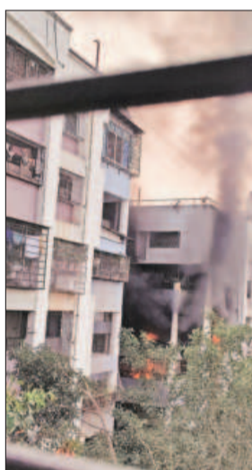
(वय ४४) सदनिकेत होते. आग लागल्यानंतर कलदोणकर बाहेर पडले. सदनिकेत मोठ्या प्रमाणावर धूर झाल्याने संगारवा आणि बोरकर यांना बाहेर पडता आले नाही. आग

पुणे : कोठव्यातील एनआयबीएम रस्त्यावर सदनिकेत रविवारी दुपारी लागलेल्या आगीत ज्येष्ठ महिलेचा होरपळून मृत्यू झाला. तर, एक ज्येष्ठ नागरिक गंभीर जखमी झाला. अग्निशमन दलाच्या जवानांनी घटनास्थळी धाव घेऊन आग आटोक्यात आणली. सदनिकेतिल देवघरात दिवा लावला होता. हवेमुळे खिडकीच्या पडद्याचा पेटत्या दिव्याला स्पॅर्श झाल्याने आग लागली.