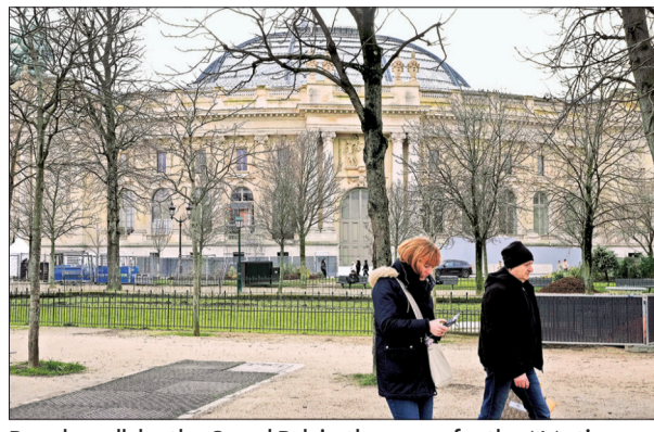
People walk by the Grand Palais, the venue for the AI Action Summit, in Paris on Sunday

"Typically the footfalls are higher in the evenings so the staff will make the deliveries - on EV scooters - in the mornings," he explains.