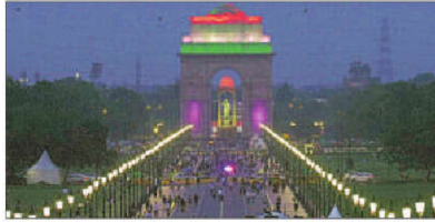
स्वतंत्रता दिवस की पूर्ण संध्या पर रांघनी से गगनमंडल उड़ान गेट।

पुलिस अधिकारियों ने बताया कि भारी पुलिस बल तैनात करने के अलावा राजधानी की सभी सीमाएं गुप्तचर मध्य रात्रि से सील कर दी जाएंगी और वाणिज्यिक तथा भारी वाहनों के प्रवेश पर प्रतिबंध होगा। उन्होंने बताया कि इससे अतिरिक्त, मध्य और नई दिल्ली में चेहरे की पहचान वाले एआइ-आधारित 700 कैमरे लगाए गए हैं। हरियाणा-दिल्ली और यूपी-दिल्ली से राजधानी की सभी सीमाएं बुधवार रात 11:30 बजे के बाद वाणिज्यिक एवं भारी वाहनों के प्रवेश के लिए सील कर दी जाएंगी। नई दिल्ली के पुलिस उपप्रधान