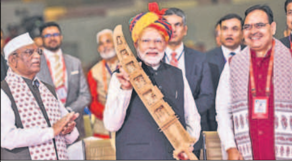
जयपुर में सोमवार को राज्रिग राजस्थान समिट में प्रधानमंत्री नरेंद्र मोदी। साथ में हैं राज्यपाल हरिभाऊ किसनराव बागड़े (बाएं) और सीएम भजनलाल शर्मा।

आईआईटी कानपुर से कंप्यूटर साइंस में स्नातक और प्रिंसटन विश्वविद्यालय से सार्वजनिक नीति में स्नातकोत्तर की उपाधि हासिल करने वाले 56 वर्षीय मल्होत्रा वर्तमान में वित्त मंत्रालय में राजस्व सचिव हैं। उनके पास बिजली, वित्त और कराधान