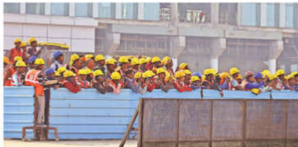
Workers look on as the first validation flight (right) takes off from the Noida International Airport, Jewar, Monday. Abhinav Saha

The airport will proceed with the next step, which is to apply for the aerodrome licence—the