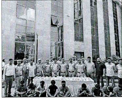
साइबर टगों की तलाश में पुलिस ने सात राज्यों में की छापेमारी

हरिद्वीप न्यूज़। नई दिल्ली। दक्षिण पश्चिमी जिले की साइबर टीम ने 19 राज्यों में छापेमारी कर 19 जालसाजों को गिरफ्तार किया है। इनमें से सात अलग-अलग तरह के साइबर फ्रॉड में शामिल हैं।