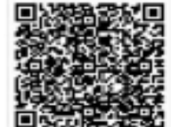
SCAN QR CODE FOR RESULTS