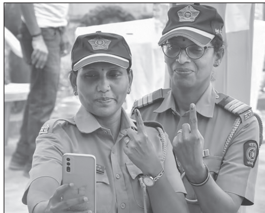
Mumbai Police personnel show their ink-marked fingers after casting votes through a postal ballot for the Maharashtra Assembly election, in Mumbai on Thursday.