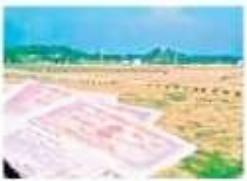
విదేశీ పరిశోధన రిజర్వ్ పన్ను...