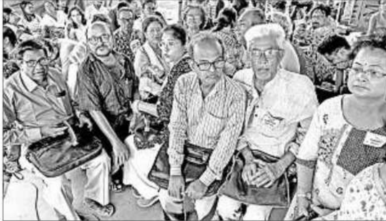
कोलकाता में शुक्रवार को कनिष्ठ चिकित्सकों के विरोध प्रदर्शन में शामिल लोग।