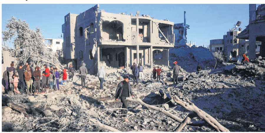
Palestinians check the destruction, after an Israeli strike, in the al-Maghazi refugee camp in the central Gaza Strip on Friday

Agencies CAIRO Israeli airstrikes killed at least 68 Palestinians across the Gaza Strip, including at a tent camp where the head of the enclave's Hamas-controlled police force, his deputy and nine displaced people died.