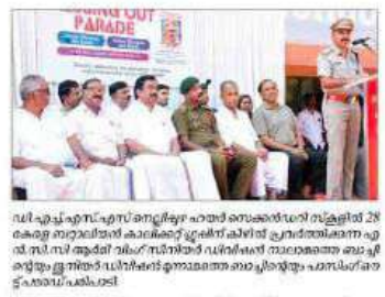
എൻ.സി.സി. പാസിയറ്റ് ട്രെയിനിംഗ്.