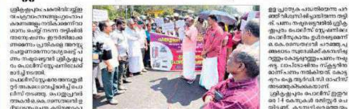
പകുതി വില തട്ടിപ്പിന് അന്വേഷണ ഓഫീസിലേക്ക് പണം നഷ്ടമായവർ പൊലീസ് സ്റ്റേഷനിലേക്ക് പ്രതിഷേധ മാർച്ച് നടത്തി.