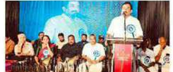
സുകുമാരൻ വാർഷിക റിപ്പോർട്ട്.