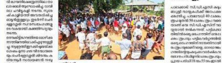
പുത്തനാൽക്കൽ താലശ്ശേരി ആഘോഷിച്ചു.