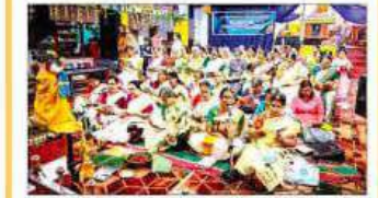
മാതൃസമിതിയുടെ യോഗത്തിൽ പങ്കെടുത്തവർ.

പ്രതിഷേധം നടത്തിയ കെ.എസ്.എസ്.പി.എസ് പ്രതിഷേധിച്ചു.