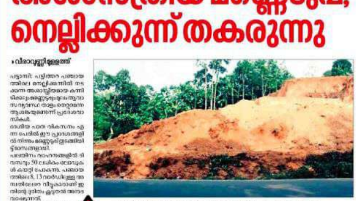
അശാന്തതയുടെ മണ്ണൊഴുക്ക്; നെല്ലിക്കുന്ന് തകരുന്നു.