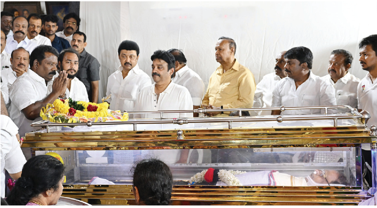
மறைந்த முரசொலி செல்வம் உடலுக்கு தமிழ்நாடு மாநில காங்கிரஸ் கமிட்டித் தலைவர் செல்வப்பெருந்தகை எம். எல்.ஏ. மலர் மாலை வைத்து அஞ்சலி செலுத்தி முதலமைச்சருக்கு ஆறுதல் கூறினார்.