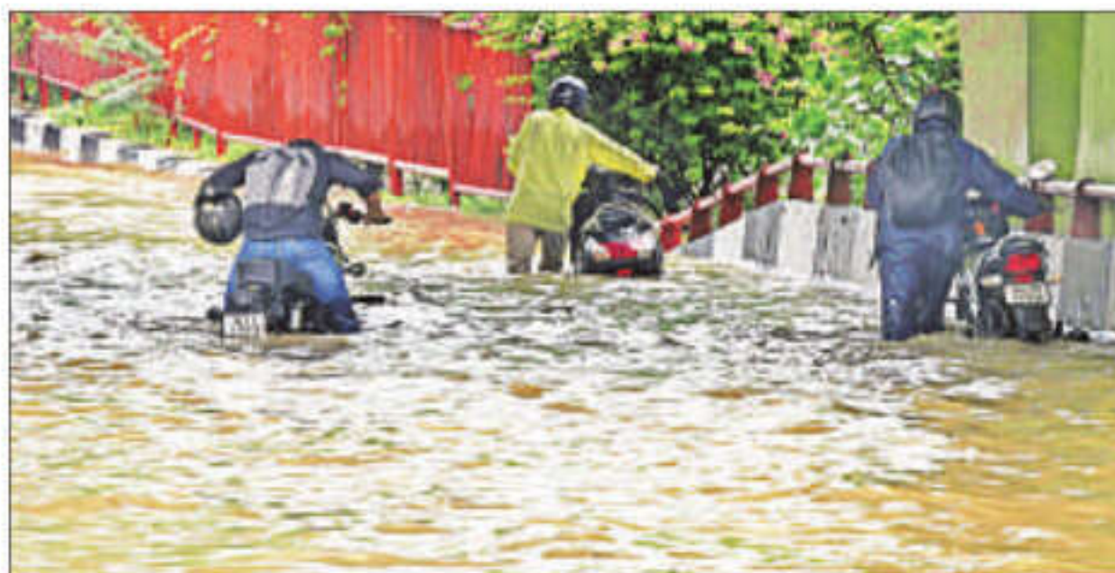
बारिश के बाद धौला कुआं अंडरपास में पानी भर जाने से यात्रियों को परेशानी का सामना करना पड़ा।

दिल्ली-एनसीआर में शुक्रवार को भारी बारिश से कई जगहों पर जलजमाव हो गया। सड़क पर पानी भरा होने से कई इलाकों में लोगों को यातायात जाम का सामना करना पड़ा। दिल्ली में धौला कुआं, मोती बाग, जीटी रोड समेत कई जगहों पर लंबा जाम लग गया। वहीं एमसीडी को शुक्रवार में सुबह 6 बजे से लेकर शाम 6 बजे तक करीब 16 स्थानों पर जलजमाव व पेड़ गिरने की 5 शिकायतें प्राप्त हुईं। बारिश से पूर्वी पटेल नगर, प्रशांत विहार, आजादपुर मंडी, किराड़ी, दिलशाद गार्डन, अजमेरी गेट, चावड़ी बाजार, नबी करीम, बापा नगर सहित कई इलाकों में लोगों को जलजमाव की समस्या का सामना करना पड़ा। हालांकि बारिश ने लोगों को उमस भरी गर्मी से थोड़ी राहत पहुंचाने का काम किया है। भारतीय मौसम विज्ञान विभाग (आइएमडी) के आंकड़ों के अनुसार, शुक्रवार को अधिकतम तापमान 3 डिग्री घटकर 31.2 डिग्री सेल्सियस दर्ज किया गया, जबकि न्यूनतम तापमान 26.5 डिग्री सेल्सियस रहा।