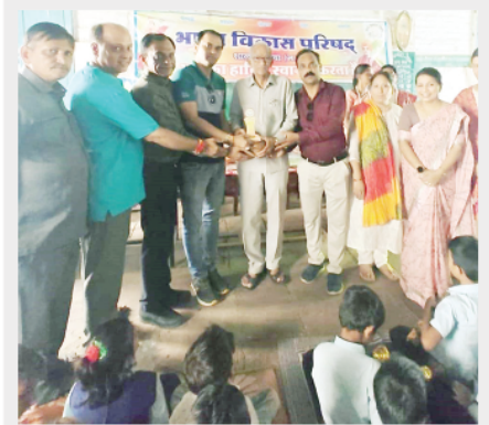
भारत विकास परिषद खंडवा द्वारा गुरूवंदन छात्र अभिनंदन प्रकल्प आयोजित