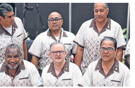
Australian Prime Minister Anthony Albanese (centre) at the Pacific Islands Forum in Tonga

ister, Anthony Albanese, said the agreement showed the Pacific family was now "closer