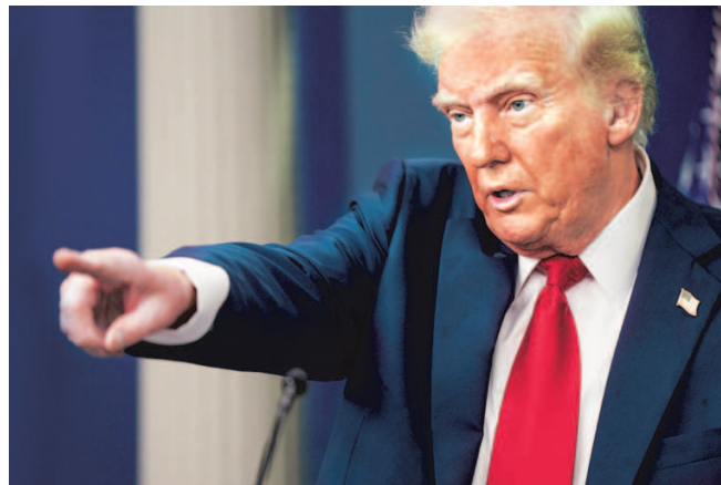
ALAN RAPPEPORT Washington, 3 February

The American President's taxes threaten to upend global economic order, could tilt the international trading system in China's favour