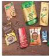
Consolidated revenue from operations during the quarter saw a 16 per cent increase

The company said its India packaged beverages business delivered 6 per cent revenue growth while the foods business grew 30 per cent, con-