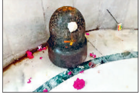
रेवाड़ी। भेरूबाबा मंदिर में रखा शिवलिंग।