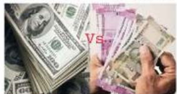
DOLLAR IMPACT. Increase in forex reserves suggests the RBI is buying dollars, preventing the rupee from appreciating

"Therefore, the inflows into the equity market seem to be absorbed by the central bank, at least to some extent, according to some market reports. Technically, the price action shows some