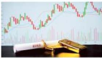
BOND EARNINGS. The government collected ₹72,274 crore via issuance of sovereign gold bonds since 2015

BUDGET IMPACT Also, fresh SGB issuances will become attractive as investors will have to invest less to buy an SGB. The Budget has proposed a cut in customs duty on gold from 15 per cent to 6 per cent. The