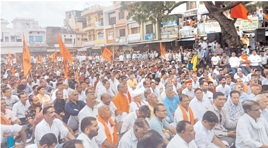
मावली। मदरसे की जमीन को लेकर विरोध रैली में उमड़ा हिन्दू समाज तथा प्रदर्शन के दौरान जमा लोग।

डबोक में भी दिखा बंद का असर, चारा-पानी को लोग तरसे - प्रशासन ने एहतियातन तैनात किया था 100 से ज्यादा जवानों का अतिरिक्त जाब्ता