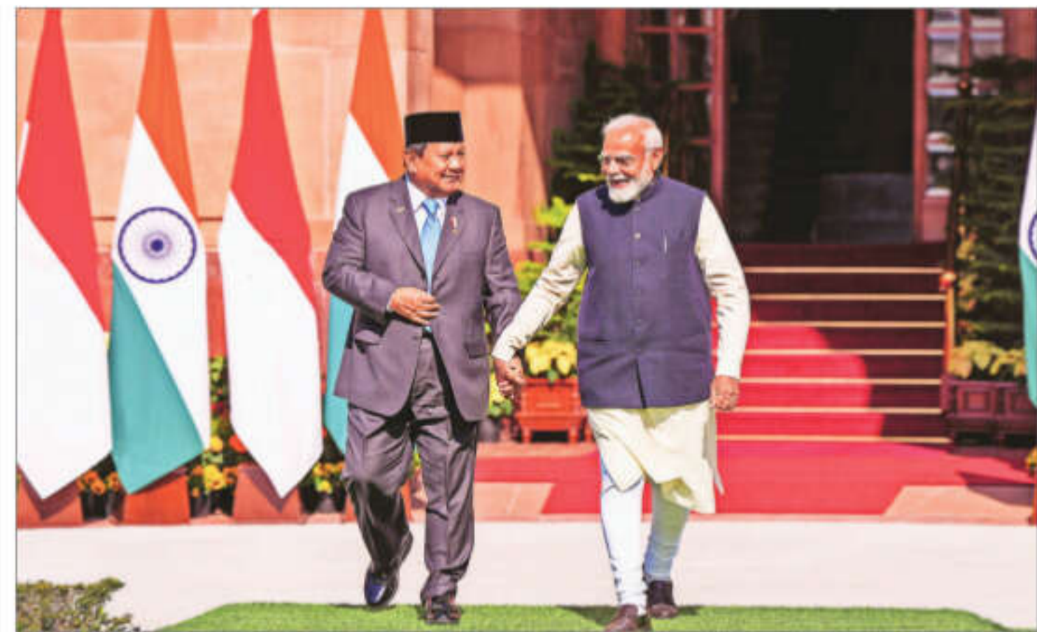
Prime Minister Narendra Modi and Indonesian President Prabowo Subianto during a meeting at Hyderabad House, New Delhi, on Saturday

Indonesian President Prabowo Subianto will be the chief guest. A 352-member marching and band contingent from Indonesia will be participating in the parade. He will be the fourth Indonesian president to attend the Republic Day celebrations.