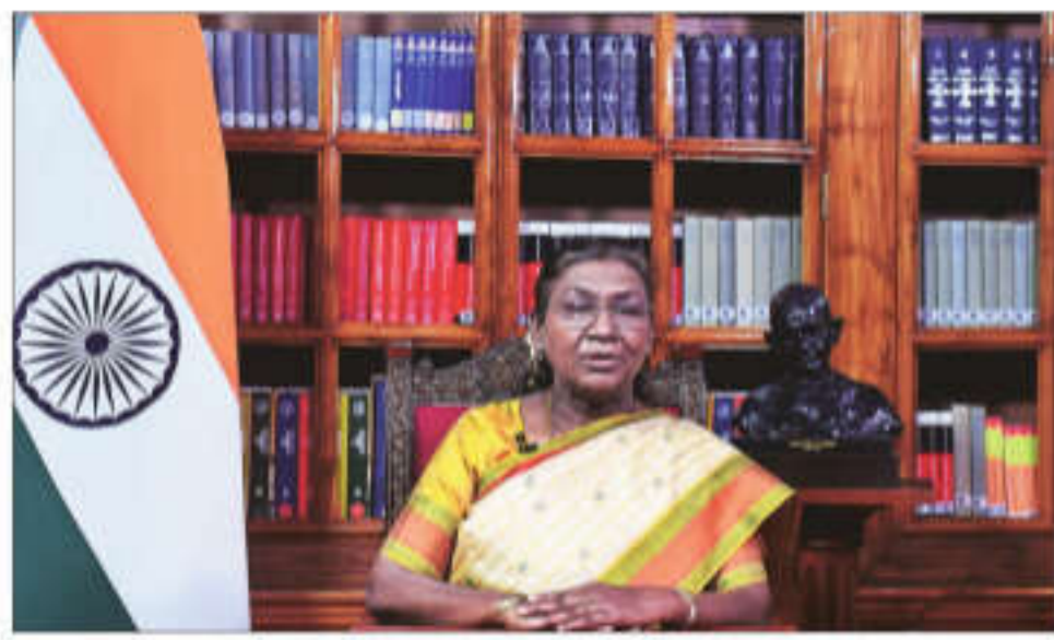
President Droupadi Murmu address to the nation ahead of the 76th Republic Day, on Saturday

PRESIDENT DROUPADI MURMU on Saturday advocated for the 'One Nation One Election' initiative, asserting it has the potential to redefine 'good governance' in the country by promoting consistency in governance, preventing policy paralysis, mitigating resource diversion, and alleviating financial burdens on the state.