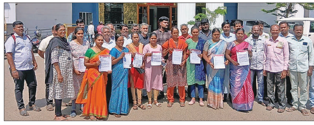
திருப்பூர் மாவட்ட ஆட்சியர் அலுவலகத்தில் நேற்று மனு அளிக்க வந்த நாம் தமிழர் கட்சியினர்.