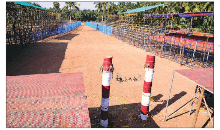
அலகுமலையில் ஜல்லிக்கட்டு நடைபெறவுள்ள இடத்தில் அமைக்கப்பட்டுள்ள வாடிவாசல் மற்றும் கேலி.

கட்டு நடைபெறவுள்ள பகுதியை சுற்றிலும் கேரிகள் அமைக்கும் பணி மற்றும் வாடிவாசல் அமைக்க கட்டு போட்டி நடைபெற உள்ளது. வாடிவாசல் இருந்து மாடுகள் வெளியேறும் பகுதியில் தேங்காய் நாள் நிரப்பும் பணி கரும்பிழைக்காலை நிறுத்துவது செய்துள்ளனர். மாடுகள் அமைத்து வரும் பகுதி, வெளியேற்றும் இடம் உட்பட போதிய பாதுகாப்பு ஏற்பாடுகளை அலகுமலை ஜல்லிக்கட்டு காளைகள் நலச்சங்க நிர்வாகிகள் செய்து வருகின்றனர்.