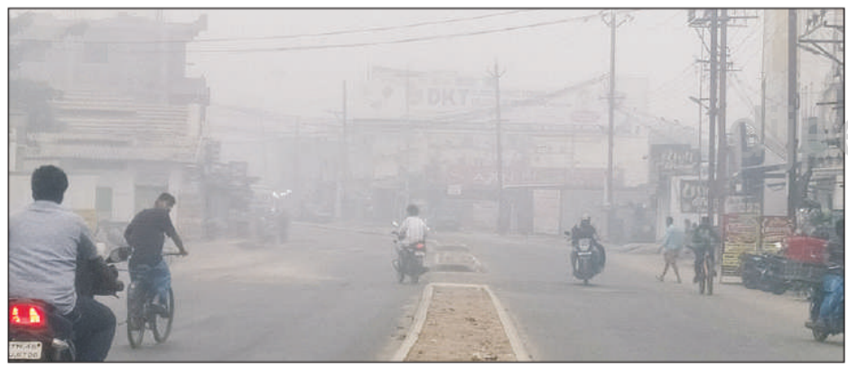
திருப்பூர் காங்கயம் சாலையை நேற்று காலை 8 மணிக்கு கழிந்த பனி.