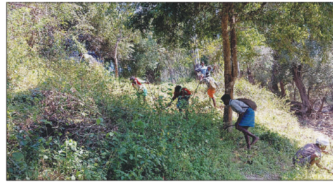
உடுமலை அருகே வனப்பகுதியில் தீ தடுப்புக்கோடுகள் அமைக்கும் பணியில் ஈடுபட தொழிலாளர்கள்.

உடுமலை திருப்பூர் வனக் கோட்டத்தில் தீ தடுப்புக்கோடுகள் அமைக்க ரூ.94.61 லட்சம் நிதி ஒதுக்கியும், தினசரி ஒருவருக்கு ரூ.200 மட்டுமே கூலியாக வனத்துறையினர் தருவதாக மலைவாழ் மக்கள் புகார் தெரிவித்துள்ளனர். ஆணைமலையில்காப்பகத்துக்கு உட்பட்ட திருப்பூர் வனக் கோட்டம் சுமார் 608 சது. கி.மீ. பரப்பளவில் அமைந்துள்ளது. உடுமலை, அமராவதி, கொழும்பு, காங்கயம், வந்தரவு ஆகிய வனச் சரகங்கள் இந்த வனக்கோட்டத்தில் அடங்கும். கோடை காலத்தில் வனப்பகுதியில் இயற்கையாக ஏற்படும் தீ விபத்துகளை தடுக்கும் வகையில் ஆண்டுதோறும் கோடை காலத்துக்கு முன்பே தீ தடுப்புக்கோடுகள் அமைப்பது வழக்கம். அதேபோல இந்த ஆண்டும் பணிகள் நடைபெற்று வருகின்றன. இதற்காக அரசு ரூ.94.61 லட்சம் நிதி ஒதுக்கி செய்துள்ளது. மலைவாழ் மக்களுக்கு வேலைவாய்ப்பு அளிக்கும் வகையில், இப்பணிகளில் அவர்களையே ஈடுபடுத்த வேண்டும் என அரசு அறிவுறுத்தி