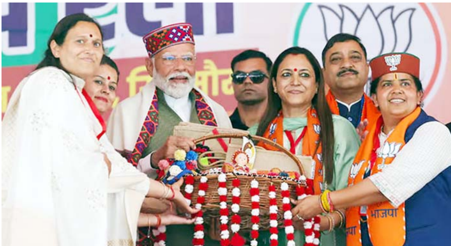
લોકસભાની ચોક્કસ રહેલી ચૂંટણીને લઈને શુક્રવારે વડાપ્રધાન નરેન્દ્ર મોદી હિમાચલ પ્રદેશના ચૂંટણી પ્રવાસ દરમિયાન સિરમોર જિલ્લામાં ભાજપની ચૂંટણી રેલીને સંબોધવા આવી પહોંચતા પક્ષના સ્થાનિક આગેવાનો વડાપ્રધાન મોદીનું અભિવાદન કરી રહ્યા છે.