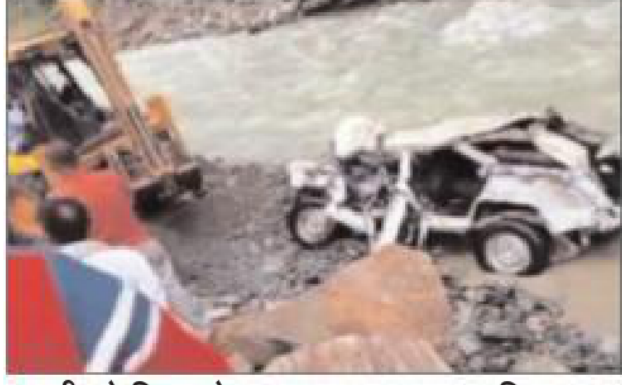
गाड़ी को निकालने का प्रयास करता प्रशासनिक दल।

जानकारी के मुताबिक मंगली निरीक्षण चौकी पर तैनात जवानों का यह दल रात के बाद भंजराडू मुख्यालय लौट रहा था। इस दौरान तरवाई के पास सुमो गाड़ी अचानक पहाड़ से हुए भूस्खलन के चट्टानी मलबे की चपेट में आ गई। हादसा इतना भयानक था कि नाले में गिरने के बाद गाड़ी के परखच्चे उड़ गए। इस दौरान तीन लोग गाड़ी से छिटककर चट्टानों से टकराए। इससे उन्हें गंभीर