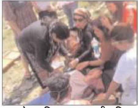
हादसे का शिकार इंजरायली महिला को संभालते लोग।

घटना के तुरंत बाद महिला को उपचार के लिए केलंग अस्पताल