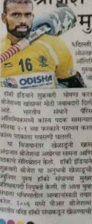
युवा संघाला तयार करणार

श्रीज्येष्ठ हॉकी संघाचा मुख्य प्रशिक्षक युवा संघाला तयार करणार. श्रीज्येष्ठ हॉकी संघाचा मुख्य प्रशिक्षक युवा संघाला तयार करणार.