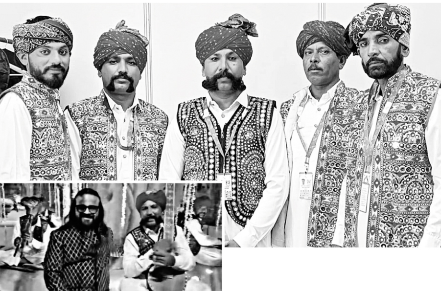
ઉદ્યોગપતિ અંબાણી પરિવારના ઘરે મુંબઈમાં લગ્ન પ્રસંગે કચ્છી કલાકારોને પણ બોલાવવામાં આવ્યા હતા. ઈ-સેન્ટમાં મોરચંગ પર રંગત જમાવી રહ્યા છે.