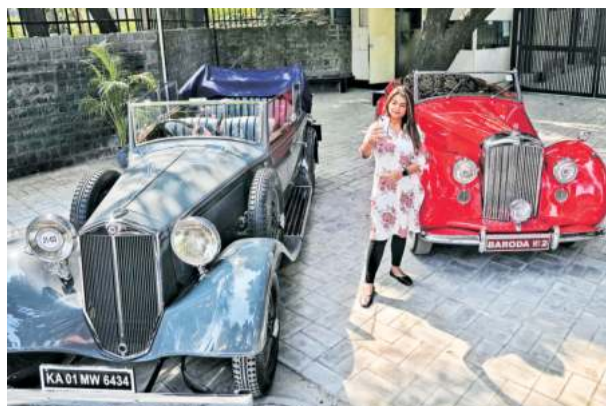
Two vintage cars on display at the National Sports Club of India in New Delhi on Tuesday. These will be among over 100 vintage cars to be showcased at the 11th edition of 21 Gun Salute Concours d'Elegance, set to be held between February 21 and 23. Abhinav Saha