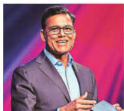
Sajjan Jindal, CMD of JSW Group, at the Invest Karnataka Summit 2025, in Bengaluru on Tuesday

"I am proud to announce that today (Tuesday), we are signing an MOU of ₹100,000 crore, and including the ongoing investments, JSW will be investing close to ₹1.2 lakh crore in Karnataka over the next few years, which will provide thousands of employment opportunities in the state. "As a long-term investor in