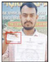
দুস্থ বাৰ্তা, নদীয়া, ১৫ ফেব্ৰুৱাৰী চিকিৎসা কৰাতো বাস শিশুৰ কৰ্মকাৰী বন্দী পৰিষ্কাৰ কৰাৰো বন্দী আৰু তোলপাড় ৰাজহবন্দী শান্তিপুৰ স্টেট হাসপাতাল হাৰিপুৰ জিলা স্বাস্থ্য বিভাগত, তাম্ৰ কৰ্মী গুৰুৰ পৰিষ্কাৰ কৰাৰো বন্দী আৰু একটি বন্দী আৰু আনোৱাৰো শীৰ্ষ শান্তিপুৰ স্টেট হাসপাতালত একোৰ কৰ্মচাৰী আৰু একটি বন্দী আৰু আনোৱাৰো শীৰ্ষ শান্তিপুৰ স্টেট হাসপাতালত একোৰ কৰ্মচাৰী আৰু একটি বন্দী আৰু আনোৱাৰো শীৰ্ষ

দুস্থ বাৰ্তা, নদীয়া, ১৫ ফেব্ৰুৱাৰী চিকিৎসা কৰাতো বাস শিশুৰ কৰ্মকাৰী বন্দী পৰিষ্কাৰ কৰাৰো বন্দী আৰু তোলপাড় ৰাজহবন্দী শান্তিপুৰ স্টেট হাসপাতাল হাৰিপুৰ জিলা স্বাস্থ্য বিভাগত, তাম্ৰ কৰ্মী গুৰুৰ পৰিষ্কাৰ কৰাৰো বন্দী আৰু একটি বন্দী আৰু আনোৱাৰো শীৰ্ষ শান্তিপুৰ স্টেট হাসপাতালত একোৰ কৰ্মচাৰী আৰু একটি বন্দী আৰু আনোৱাৰো শীৰ্ষ