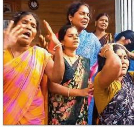
Fishermen's family in Puducherry on Tuesday

BEIJING: China said it stressed on handling differences and promotion of India-China relations on a stable track in the just concluded talks with foreign secretary Vikram Misri while highlighting decisions to resume Kailash Mansarovar Yatra and direct flights. In its readout in Mandarin issued on Tuesday, the Chinese foreign ministry said the dialogue focussed on promoting the implementation of the important consensus reached by the leaders of China and India in the Kazan meeting on the sidelines of the BRICS summit last year and discussed measures to improve and develop China-India relations. It highlighted the consensus reached between the two sides during the talks which included the resumption of direct flights, the Kailash Mansarovar Yatra and a meeting of expert-level mechanism. -PTI