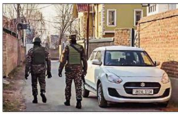
CRPF personnel during an NIA search operation at Sopore in Baramulla on Tuesday