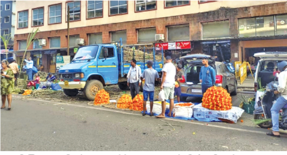
तुळशी विवाहासाठी फोंडा बाजारपेठेत दाखल झालेली झेंडूची फुले व ऊस

सणासुदीच्या काळात फुलांना खूप मागणी असते. त्याचप्रमाणे, तुळशी विवाहानिमित्त बाजारपेठेत फुलांची विक्री वाढल्याचे दिसून येते. सध्या केशरी, पिवळी झेंडूची फुले ३२० रुपये किलो दराने विकली जात आहेत. पांढऱ्या फुलांचे हार ५० रुपये मीटर आणि अन्य फुलांचे हार ५० रुपये प्रति मीटर, तर शवंतीच्या फुलांचा हार ७० रुपये प्रति मीटर व गुलाब ३२० रुपये किलो अशा दराने विक्री केली जात आहे. तुळशी विवाहाच्या वेळी फुलांना जास्त मागणी असते. त्यामुळे दरातही वाढ झालेली आहे, असे मडगावातील फुल विक्रेत्यांनी सांगितले.