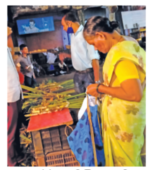
मडगाव येथे तुळशी विवाहासाठी खरेदी करताना ग्राहक.

मंगळवारी बाजारात खरेदीसाठी लोकांची गर्दी दिसून आली. स्थानिक विक्रेत्यांनी ऊस व चिंचा यांचा एक वाटा १०० रुपये अशा दराने विक्री करण्यास सुरुवात केली आहे, तर आवळा, चिंचा यांचा वाटा ५० रुपयांना एक याप्रमाणे विक्री होत आहे. तुळशी विवाहासाठी अनेकांकडून उपवास केला जातो. त्यासाठी पोहे, कंदमुळे खाल्ली जातात. या दिवसात लाल काटेकंणगी मोठ्या प्रमाणात विक्रीसाठी उपलब्ध होत आहेत. त्यामुळे सध्या स्थानिक महिला विक्रेत्या गावठी कणगीची विक्री करताना दिसून येत आहेत. या कणगीची १०० रुपये वाटाप्रमाणे विक्री होत आहे.