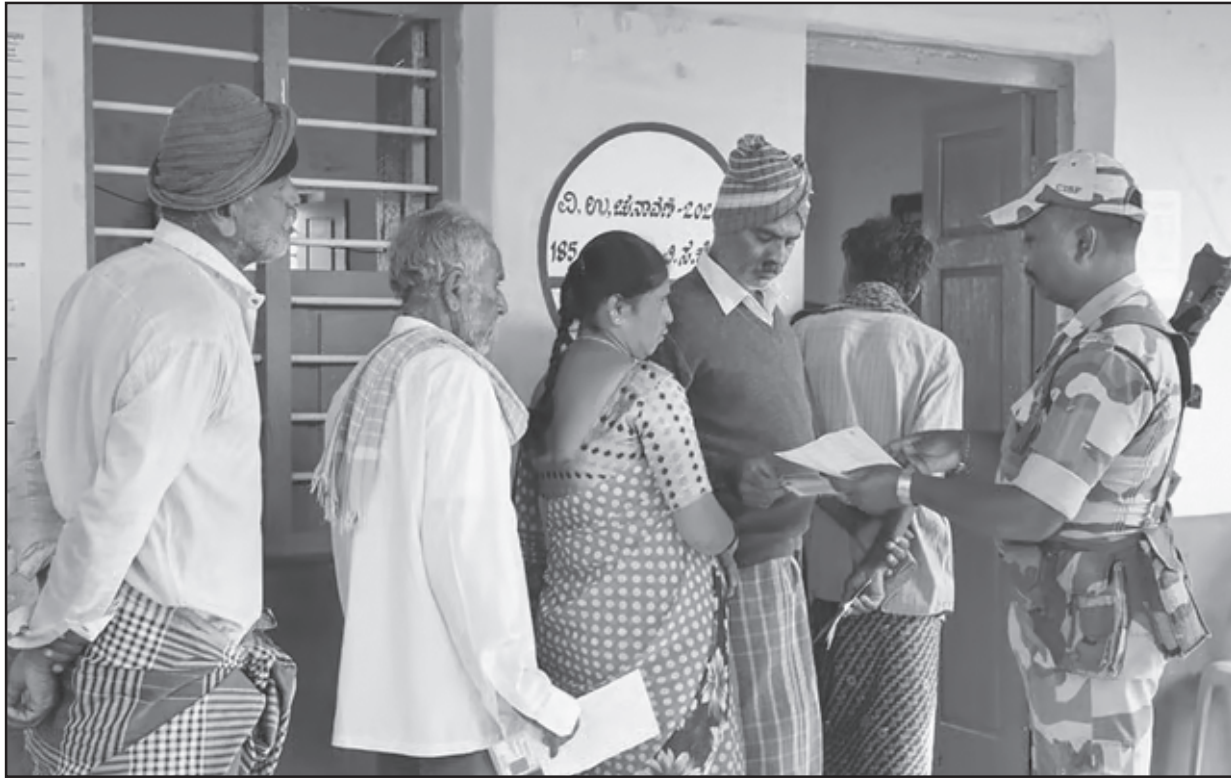
A security personnel checks voter ID as voters wait to cast votes at a polling station during the Channapatna Assembly by-poll, Karnataka.