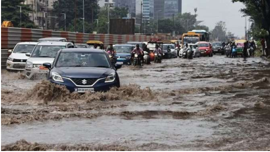
हमारा स्वराज > इंदौर

इंदौर में तेज बारिश हुई और पूरा शहर जलभराव से जूझ रहा। मौसम विभाग के अनुसार दिनभर में पौने दो इंच बारिश हुई। सुबह 11 बजे शुरू हुई बारिश को बज धमी और चार बजे से फिर तेज बारिश हुई। इस दौरान शहर की सड़कों पर पानी भर गया। इंदौर में जब भी तेज बारिश होती है इसी तरह सड़कों पर सीवरेज का गंदा पानी भर जाता है। नगर निगम कार्यालय के बाहर ही सीवरेज का गंदा पानी सड़कों पर लबालब भर गया। राजबाड़ा के साथ विजय नगर, नंद नगर, पलासिया, बड़ा गणपति, अन्नपूर्णा, बीआरटीएस, महे नाके में भी इसी तरह