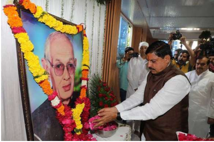
हमारा स्वराज > इंदौर