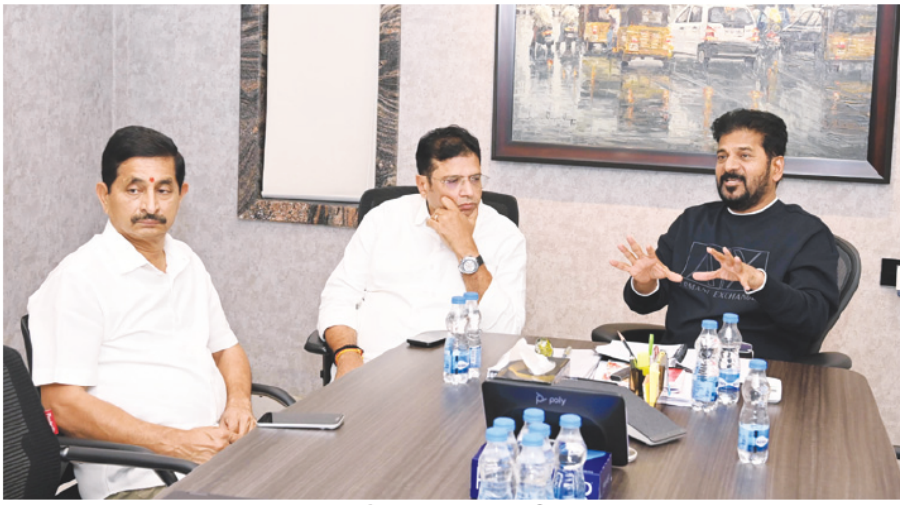
సమీక్షలో ముఖ్యమంత్రి సీఎం రేవంత్ రెడ్డి పదాధిపతి రాష్ట్ర స్థాయిలో హైదరాబాద్ పెట్టుబడుల వచ్చాయని ముఖ్యమంత్రి రేవంత్ రెడ్డి వ్యక్తం చేశారు. జనవరి 16 నుంచి 19 వరకు సీఎం రేవంత్, 20 నుంచి 22 వరకు దావోస్ పర్యటన చేపట్టారు. దావోస్ లో రెవంత్ రెడ్డి ప్రభుత్వం అవకాశాలను గురించి ఆదికారాలకు సీఎం రేవంత్ రెడ్డి వ్యక్తం చేశారు. దేశ విదేశాల్లో పేరొందిన కంపెనీలు భారత్ పెట్టుబడులు పెట్టేందుకు రాష్ట్రంలో అనుకూలమైన వాతావరణముండని అభిప్రాయపడ్డారు. పూర్వరోసిటీగా వెలుగుతున్న హైదరాబాద్ లో ఉన్న సానుకూలతలను ప్రపంచ వేదికపై పరిచయం చేసేందుకు సన్నద్ధంగా ఉండాలని ఆదికారాలను సీఎం రేవంత్ రెడ్డి అభిప్రాయం వ్యక్తం చేశారు.