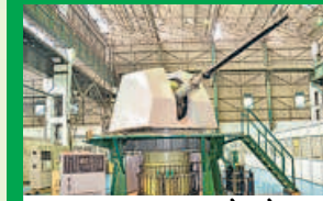
रक्षा एवं एयरोस्पेस