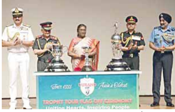
डूरंड कप की ट्रॉफियों का अनावरण करती राष्ट्रपति द्रौपदी मुर्मू।

(आज समाचार सेवा) नयी दिल्ली, 10 जुलाई। राष्ट्रपति द्रौपदी मुर्मू ने डूरंड कप टूर्नामेंट 2024 में भाग लेने वाले सभी खिलाड़ियों को शुभकामनाएं देते हुये कहा है कि चाहे वे हारें या जीतें, खेल में स्वस्थ प्रतिस्पर्धा होनी चाहिए और उन्हें दूसरी टीमों का सम्मान करना चाहिए। राष्ट्रपति ने आज राष्ट्रपति भवन के सांस्कृतिक केंद्र में आयोजित एक समारोह में डूरंड कप टूर्नामेंट 2024 की तीन ट्रॉफियों, डूरंड कप, प्रेसिडेंट कप और शिमला ट्रॉफी का अनावरण करते हुये उक्त बातें कहीं। राष्ट्रपति ने कहा कि फुटबॉल दुनिया के सर्वाधिक लोकप्रिय खेलों में से एक है। जब पेशेवर फुटबॉल खिलाड़ी हजारों प्रशंसकों के सामने खेलते हैं, तो खिलाड़ियों और दर्शकों का उत्साह कई गुना बढ़ जाता है। राष्ट्रपति ने डूरंड कप टूर्नामेंट 2024 में भाग लेने वाले सभी खिलाड़ियों को शुभकामनाएं दीं। उन्होंने खिलाड़ियों से कहा कि चाहे वे हारें या जीतें, खेल में स्वस्थ प्रतिस्पर्धा होनी चाहिए और उन्हें दूसरी टीमों का सम्मान करना चाहिए।