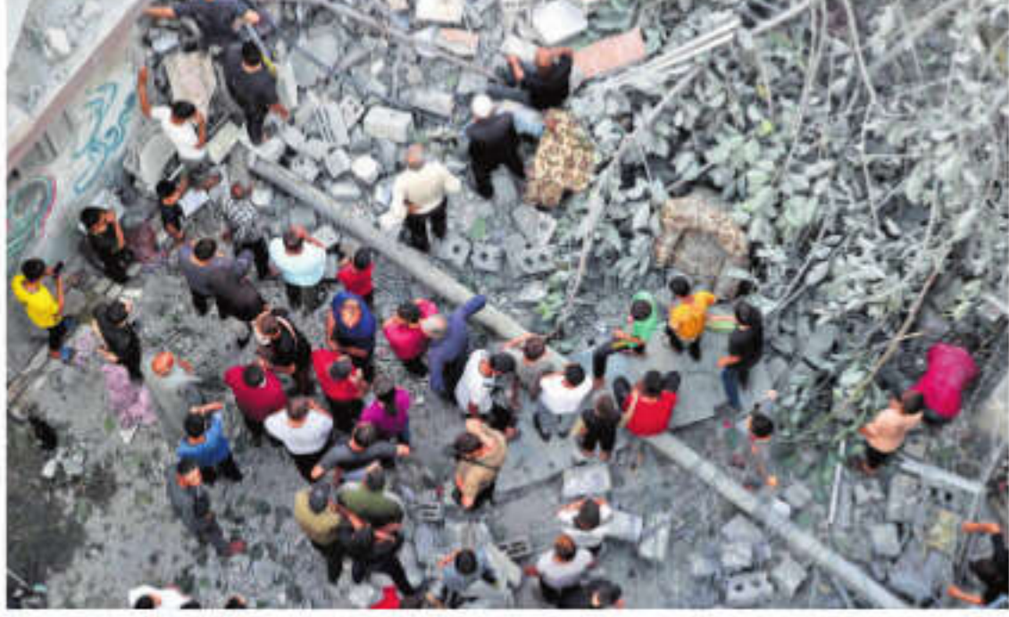
Palestinians search for survivors at the site of an Israeli strike on the Al-Daraj neighbourhood in Gaza City

But National Security Adviser Tzachi Hanegbi, in a joint statement with the foreign ministry, said "Israel has not and will not carry out military operations in the Rafah area that create living conditions that could cause the destruction of the Palestinian civilian population, in whole or in part."